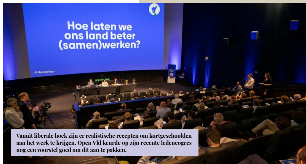
Vanuit liberale hoek zijn er realistische recepten om kortgeschoolden aan het werk te krijgen. Open Vld keurde op zijn recente ledencogres nog een voorstel goed om dit aan te pakken.

Het probleem is dat onze verstikkende participatie keer op keer veto's uitspreekt en te weinig bereid is om heilige huisjes op te