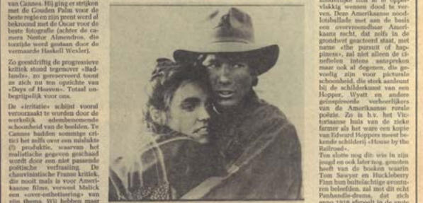
Brooks Adams en Richard Gere in «Days of Heaven» van T. Malick