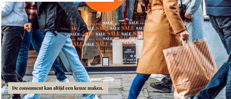
De consument kan altijd een keuze maken.

Is de consument echt machteloos tegenover grote macro-economische mechanismen? Hij of zij kan alleszins bewust handelen en niet als een kudde-dier de reclame volgen. Er is een keuze.