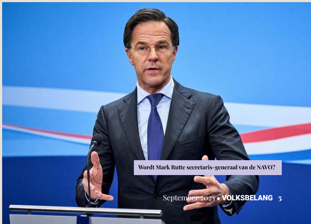
Wordt Mark Rutte secretaris-generaal van de NAVO?

De vraag is of Mark Rutte volgende najaar een kans maakt om de nieuwe EU-commissaris te worden of dat hij zijn zinnen heeft gezet op de opvolging van de Stoltenberg als nieuwe NAVO-secretaris-generaal. Laten we niet vergeten dat onze noorderburen een traditie hebben met het Atlantisch militair bondgenootschap, want Dirk Stikker, Joseph Luns en Jaap de Hoop Scheffer hebben de NAVO eerder al geleid. Met zijn ervaringen en kennis van de leer van Machiavelli is er zeker nog een politieke toekomst voor Mark Rutte!