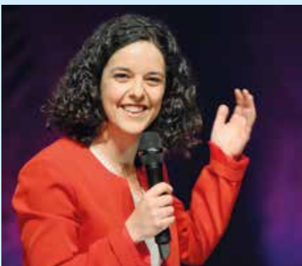
Manon Aubry van de Linkse fractie.

De rechtse fractie ID spotte onverholten met die benadering: "Het enige redmiddel is een prijsplafonnering", zei Marco Zanni. "Wat u vertelt is pure retoriek". Ook de conserva-