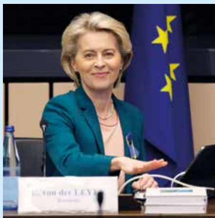
Ursula von der Leyen.

Daaruit valt vooral te onthouden dat de maatregelen die de Commissie beoogt om de energiecrisis te bezweren minder rekening houden met de noden van de burger dan met de verankering van de grote bedrijven.