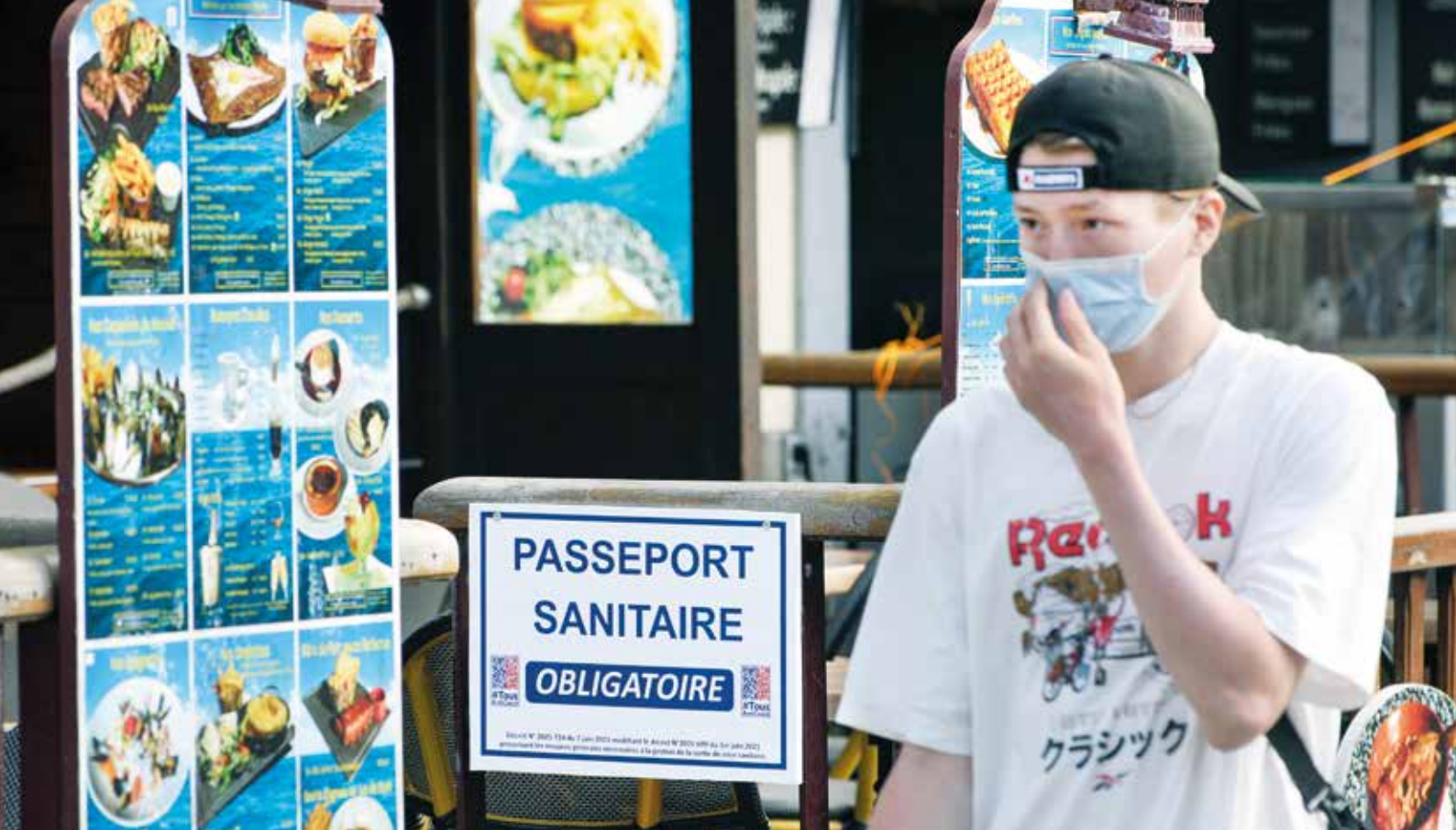
In Frankrijk werpt de coronapas zijn vruchten af: de Fransen laten zich plots massaal vaccineren. In België wordt de pas gezien als iets “Orwelliaans”.

den weggepromoveerd. De onmondigheid van de burger om hen ter verantwoording te roepen wordt vooral veroorzaakt door de complexiteit van onze samenleving. Dit is des te duidelijker in een land als België met zijn gekunstelde staatsstructuur waarin een kat haar jongen niet terugvindt. Er is een totaal gebrek aan hiërarchie en verantwoordelijkheidszin omdat die verantwoordelijkheid overal een beetje verspreid zit. Het lappendeken aan bevoegdheden is zodanig deel beginnen uitmaken van het politieke DNA van ons land, dat de bevolking erin berust en zelfs de moeite niet meer neemt om individuele politici ter verantwoording te roepen. Iedereen is bevoegd, niemand is verantwoordelijk, en niemand die zich daar vragen bij stelt. Bevragingen tonen aan dat de corona-aanpak in ons land knaagt aan het vertrouwen in politieke instellingen. Toch zie je de politiek niet hengelen naar meer vertrouwen bij de burger, die gaat gewoon voort op de ingeslagen weg, buiten het parlement om. De participatie lijkt weinig te geven om het tanende vertrouwen dat onmondig