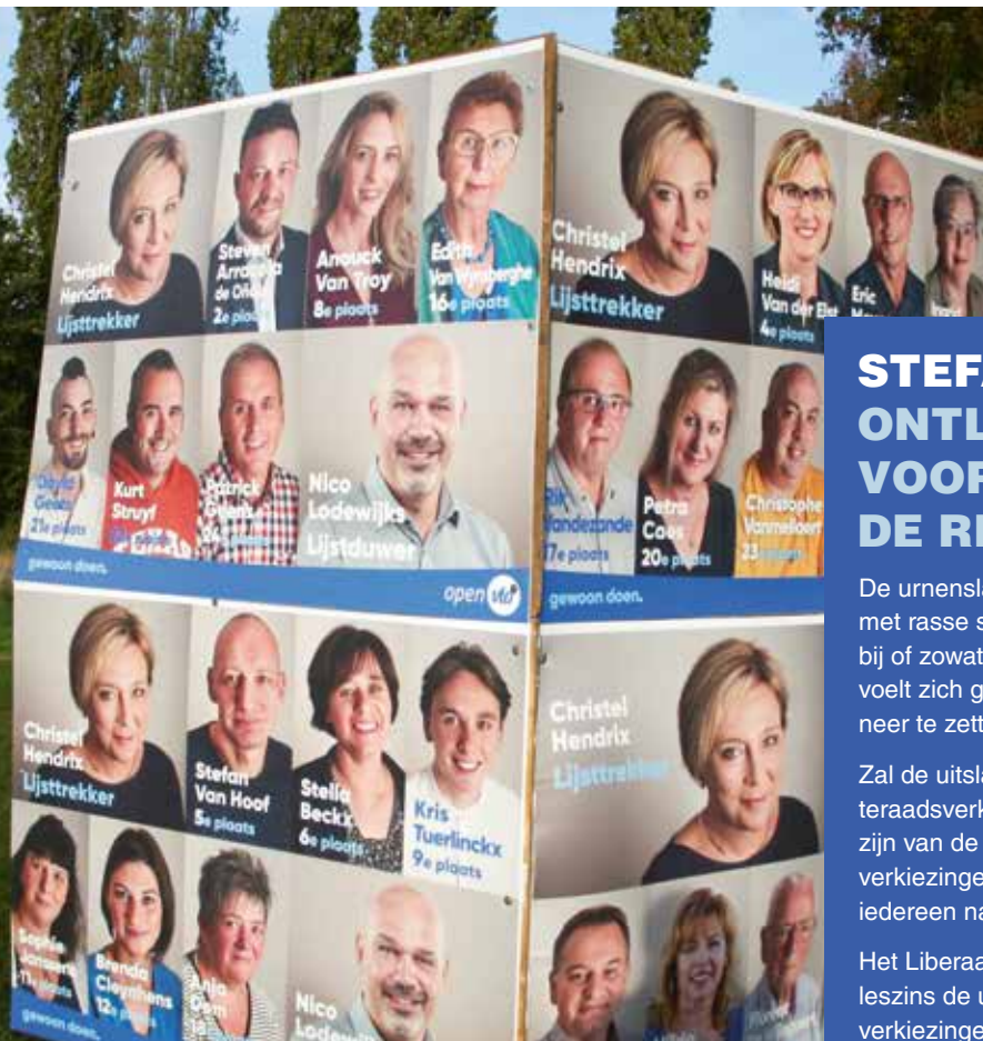
De gemeenteraadsverkiezingen hebben altijd wel wat invloed op de volgende federale en regionale verkiezingen.

tal leden wordt gehalveerd tot 36, of 31 voor Limburg. Voor de kleinere partijen wordt dat geen gemakkelijke opdracht om nog aan zetels te geraken. Dit niet alleen omwille van het lagere aantal te begeven zetels, maar ook door de spreiding ervan over de 2 of 3 provinciale kiesdistricten.