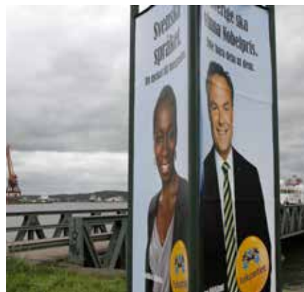
Wat nu rest is een politiek imbroglio, een maatschappelijke verdraagzaamheidsparadox.

De gevolgen zijn er naar: een groeiende gedachtenuniformisering, ongeremde overheidsinterventies en sluimerende onrust die laveert tussen apathie en uitwas. Paradoxaal genoeg ontstaan zo tegenstrijdige houdingen: hoe hoger de prijs van alcohol in besloten staatswinkels, hoe meer dronkenschap; hoe weldenkender het staatsraison, hoe nukkiger de burger; hoe moralistischer het maatschappelijk toezicht, hoe sterker de afkeer van gezag, politiek, godsdienst, het academische en het economische. Dit is in een notendop de aanloop in wat zich de voorbije tien jaar aftekent in de Noordse landen (IJsland uitgezonderd): verwerping van de burgerzin, toenemend populisme, uitbarstingen van gratuit geweld, geflirt met autoritaire modellen die nog versterkt worden door de inwijkingscrisis. Het conflictdenken is het nieuwe normaal.