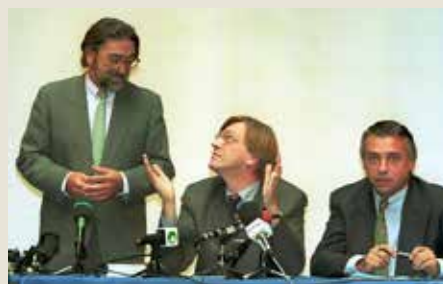
Met Guy Verhofstadt en Patrick Dewael: tijdens zijn partijvoorzitterschap (1995-1997) werd Herman De Croo het mikpunt van een ongemeen harde beschadigingsoperatie.

De Croo drukt het heel zacht uit, want de werkelijkheid was minder fraai. Deze jaren zouden voor de VLD één van de meest zwarte worden uit de jonge geschiedenis van de partij.