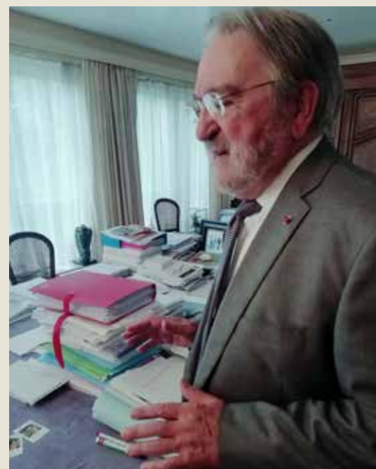
Herman De Croo aan zijn werktafel thuis in Brakel, met het lijvige manuscript van zijn autobiografie.

Kortom, een staatsman, en een groot (sociaal) liberaal. Onthecht van het geloof maar geen vrijmetselaar: “Ik heb geen kerk verlaten om een kapel binnen te treden”. En bovenal, man van de gewone man, die hij met onverdroten ijver via zijn dienstbetoon, hielp waar hij kon: “Ik ben gehecht gebleven aan mijn wortels,