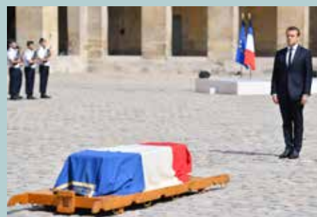
Op 5 juli 2017 werd Simone Veil ten grave gedragen tijdens een nationale uitvaart met de Franse president Emmanuel Macron.

In 2010 werd ze opgenomen in de Académie Française, in de zetel die ooit door Jean Racine was bekleed. Het werd haar laatste groots optreden. Na de plotse dood van haar man, in 2013, werd het stiller rond haar. Twee jaar geleden, dertig jaar na datum, werd haar heroïsche strijd voor de legalisering van abortus geëvoceerd in de uitstekende film «La Loi», met Emmanuelle Devos in haar rol. Voor wie