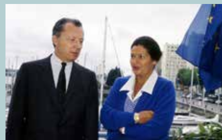
September 1988 met Jacques Delors, voorzitter van de Europese Commissie.

magistratuur omdat haar man niet wenst dat ze advocaat wordt. Wie dacht dat ze voor een gezapig ambtenaarsbestaan zou kiezen, vergiste zich echter. Ze ijverde met succes voor de verbetering van de ellendige toestand in de gevangnissen, voor het toekennen van het statuut van politiek gevangene aan de Algerijnse rebellen. In 1964, stapt ze over naar de directie van burgerrechtelijke zaken. Van daaruit speelt ze een beslissende rol in de hervorming