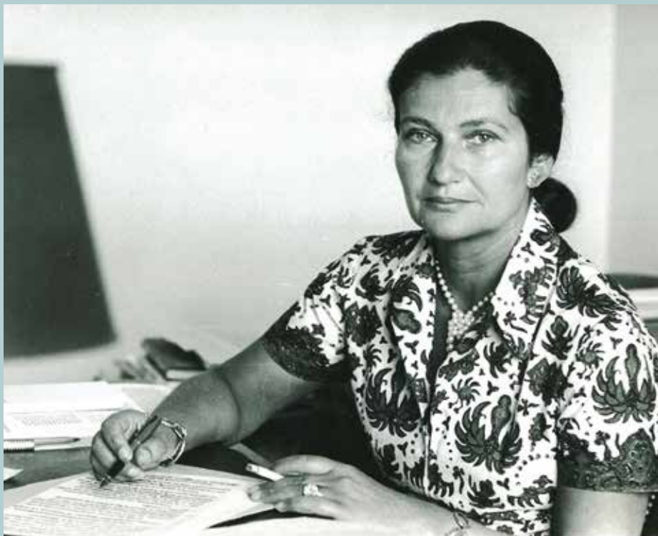
Simone Veil in 1974 als minister van Volksgezondheid in de regering-Chirac.

Geboren in Nice in 1927 in een Joods burgergezin, beleefde Simone Jacob, als jongste van vier kinderen, aanvankelijk een zorgeloze jeugd, ook al kwamen er vanuit Duitsland steeds dreigender berichten. In de lente van 1944 werden eerst Simone, dan haar zuster, moeder, vader en broer opgepakt door de nazi's en weggevoerd, de vrouwen naar Auschwitz, de mannen naar Silesië. Van hen zou nooit nog iets worden vernomen. Het heeft de onlangs overleden "grande dame" voor het leven getekend.