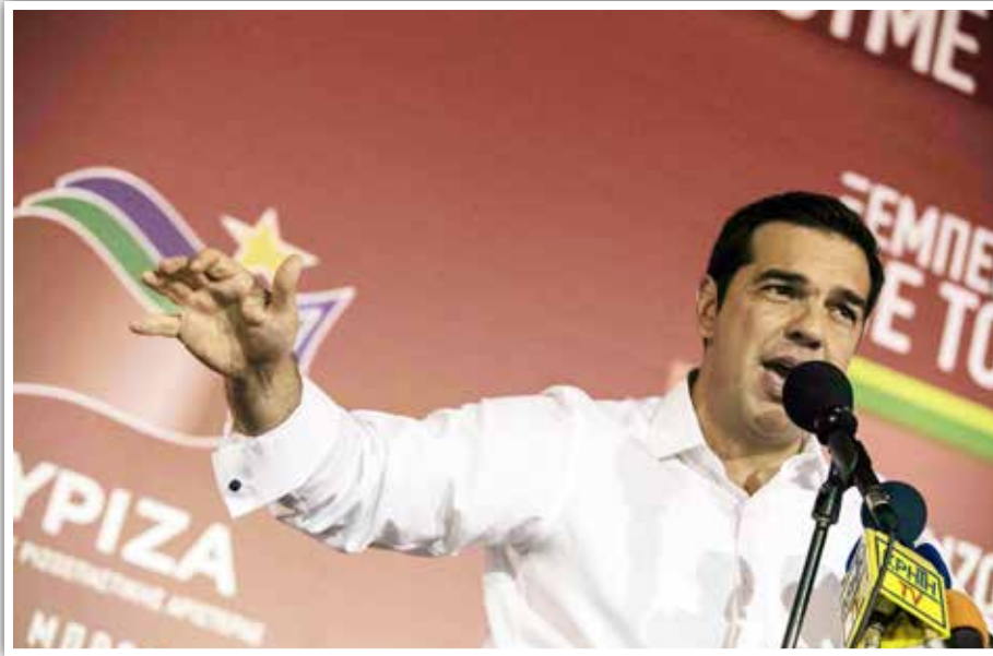
Alexis Tsipras en de radicaal-linkse partij Syriza hebben dus hun gok gewonnen.

om politieke redenen en het geringe aandeel van de Griekse economie in het EU-pakket keek de Unie de andere kant uit. Dat was vóór de wereldwijde bankencrisis, maar Athene bleef doorgaan met vervalste begrotingen. Nochtans had Karel De Gucht geen ongelijk toen hij hardop zei: “Als we Griekenland niet eens kunnen oplossen, dan is er geen Europees beleid”. De Gucht mag ook vandaag vaststellen dat er geen gemeenschappelijke wil is, of je dat nu solidariteit of gemeenschappelijke regelgeving noemt.