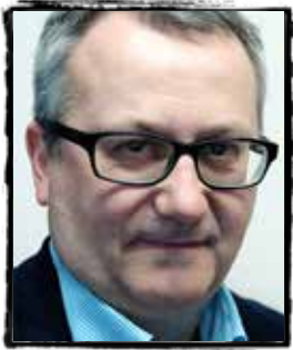
Van de redactie door Bert Cornelis