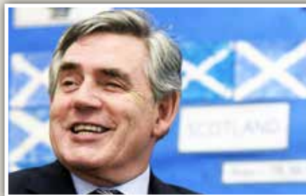
Gordon Brown, de gewezen Britse Labourpremier.

Niet de staatsversplintering van Europa vormt een bedreiging. Wel de schaalvergroting. Laat ik maar meteen de steen in de kikkerpoel werpen, en de Britse oudpremier Gordon Brown gelijk geven, toen hij wellicht een doorslaggevende tussenkomst deed in Glasgow om de Schotten te bewegen toch niet te kiezen voor onafhankelijkheid in de volksraadpleging van 18 september. "Niet het Schotse identiteitsgevoel is veranderd", zei hij, "Het echte probleem is niet Engeland maar de economische context van de globalisering".