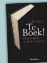
Ludo Simons, TE BOEK! Over boeken en boekenmensen. Uitgeverij Pelckmans; Kalmthout, 2014; 173 blz.; 19,50 euro.

Simons waagt zich ook aan de vraag of het nuttig, billijk, verstandig of dom zou zijn om de Koninklijke Bibliotheek te splitsen. Zoals de Tsjechen en Slovakken dat deden ("Maar dat is geen goede parallel" blz.80). Met dat model voor ogen gooit Simons een steentje in het water in de vorm van een pleidooi voor een eigen 'nationale' bibliotheek voor de Vlaamse Gemeenschap, die niet zou opereren tegen, maar naast de Koninklijke Bibliotheek, die tot dusver vanzelfsprekend tégen was. ■