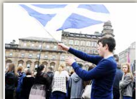
De aanhangers van de Schotse onafhankelijkheid haalden het in het referendum niet.

Het Verenigd Koninkrijk heeft duidelijk een te zwaar probleem ineens willen optillen, en het is hem in de rug geschoten. De reden is dubbel: zelfgenoegzaamheid en arrogantie. Londen heeft zich nooit verwaardigd om de Schotse eisen ernstig te nemen – Edinburg, dat gratis voorschriften voor geneesmiddelen en gratis onderwijs en hogere werkloosheids-