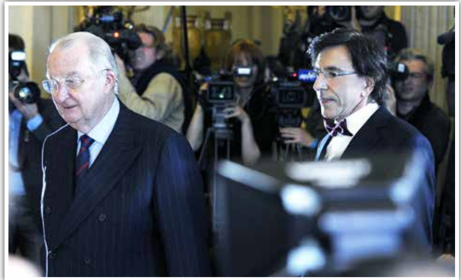
De plechtige ondertekening van de Zesde Staatshervorming in juli 2012 door Koning Albert en premier Elio Di Rupo (foto Belga).

Na de langste regeringscrisis uit de Belgische geschiedenis en onderhandelingen die in 2007 reeds 194 dagen en in 2010-2011 nog eens 545 dagen aansleepten, werd op 11 oktober 2011 het zogenaamde “Vlinderakkoord” gesloten. Dit institutioneel akkoord vormde de grondslag voor de zesde staatshervorming.