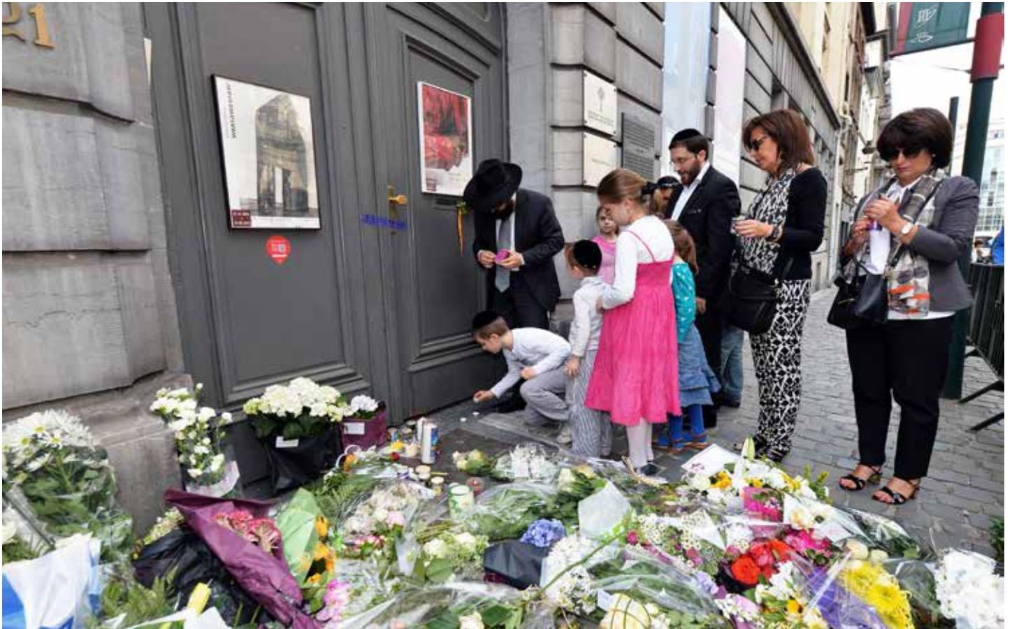
Veel mensen legden bloemen neer na de aanslag in het Joods Museum in Brussel: een hoogtepunt in het antisemitisme in België.