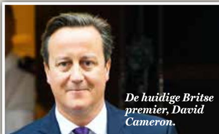
De huidige Britse premier, David Cameron.

Cameron mag nu aan zijn weg naar Canossa beginnen. Hij heeft eigen belastinginning toe-