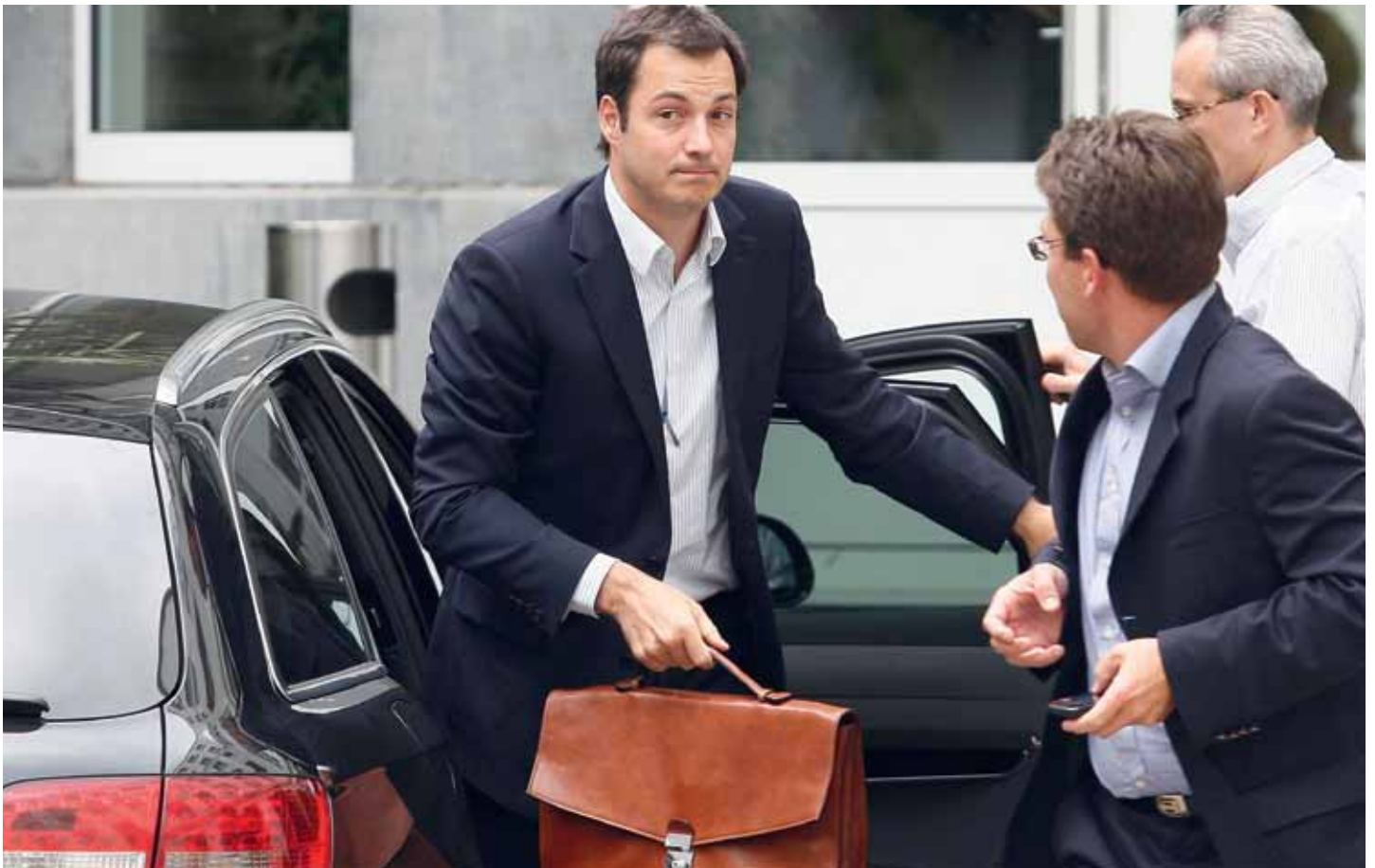
Karel Poma heeft een boodschap voor de onderhandelaars: "Alle pogingen om de 6 faciliteitengemeenten los te trekken van Vlaanderen, zijn ongrondwettelijk".

Frans Van Cauwelaert (Onze-Lieve-Vrouw-Lombeek, 10 januari 1880 – Antwerpen, 17 mei 1961) stelt voor om van België een tweetalig land te maken, met de twee landstalen, het Frans en het Nederlands,