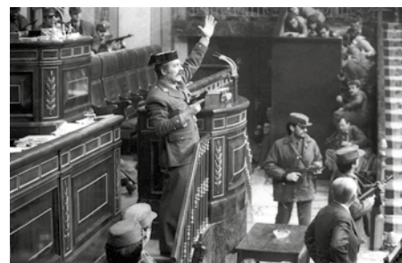
Een kolder-moment in de Spaanse geschiedenis: Generaal Antonio Tejero stormde in 1981 met 200 kompanen het parlement binnen, wild zwaaiend met een pistool.

De schaduw van Franco heeft ook een naam. Staatsterreur. Dankzij de Europese Unie is er een laagje democratie afgezet op het logge monster van een autoritair bewind. Maar in tijden van crisis brult dat monster opnieuw vervaarlijk. In den beginne leek dat potsierlijk. De clown van dienst heette toen Antonio Tejero Molina, luitenant-kolonel van de Guardia Civil. In 1978 lanceerde hij "Operatie Ga-