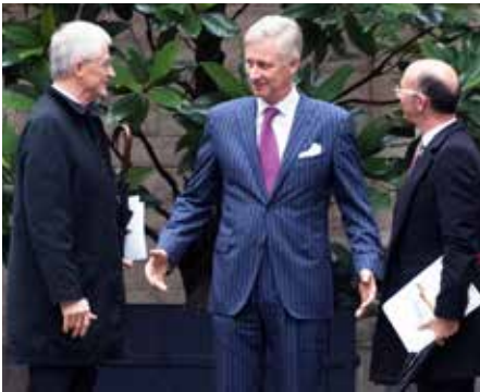
Hoe ver zullen de pre-formateurs Geert Bourgeois en Rudy Demotte geraken?