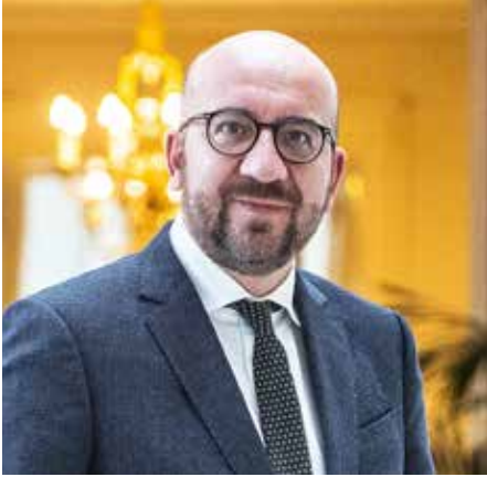
Wie wordt de opvolger van Charles Michel?