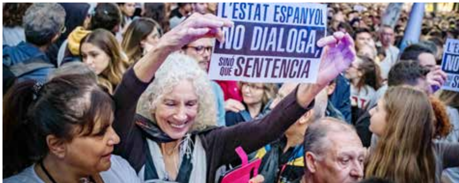
Protest in de straten van Barcelona na de veroordeling van 12 Catalanen.

ona, maar de grondwet gaat voor”. Dat wijst niet op een dialoog, maar op een dictaat. De nieuwe verkiezingen op 10 november zullen uitwijzen of dat een goed idee was. Want Sánchez is er door pietluttig opbod van machtsdeling met Unidas-Podemos niet in geslaagd een meerderheidsregering te vormen, ook al omdat de steun van de Catalaanse ERC met zijn 15 leden onontbeerlijk was; vier volksvertegenwoordigers en één senator van de Catalaanse nationalistes zijn trouwens beëdigd in de gevangenis, maar krijgen geen onschendbaarheid, de tijden van Borms zijn terug.