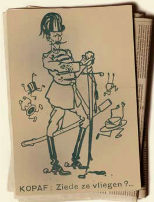
Cartoon verschenen in De Week, 19.2.1910 p. 1.