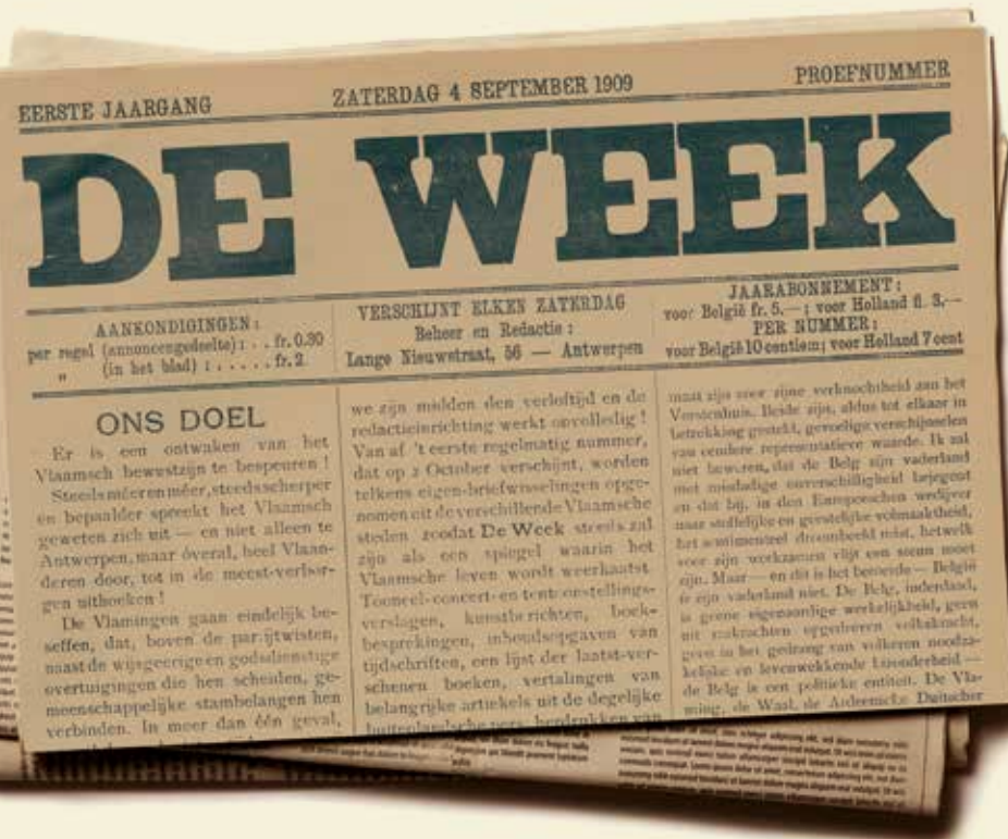
Voorpagina van het nulnummer van De Week , 4.9.1909 p. 1.

Tot de stamboom van de Vlaamse, liberaalgezinde pers behoren titels als 'Het Laatste Nieuws', 'De Vlaamse Gids' en het in 1867 gestichte 'Volksbelang', dat u nu aan het lezen bent. Het past om in deze kolommen een blik te werpen op een minder gekende en allang verdwenen titel uit de liberale familie: 'De Week.'