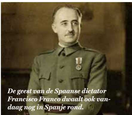
De geest van de Spaanse dictator Francisco Franco dwaalt ook vandaag nog in Spanje rond.

De gruwelen van de Spaanse Burgeroorlog zijn bekend. De lange schaduw van dictator Francisco Franco veel minder. De rechts-conservatieve Partido Popular is gewoon de voortzetting van de Alianza Popular die na Franco's dood werd opgericht door zijn vroegere minister van binnenlandse zaken en van voorlichting (censuur) Manuel Fraga Iribarne. In 1990 nam de nijldige José Maria Aznar over, zelf een lid van de Falange en van de studentenvakbond, de enige die was toegelaten door het Francobewind. Zijn opvolgers Mariano Rajoy en vandaag Pablo Casado worden geteisterd door schandalen: Rajoy viel als regeringsleider na partijcorruptie, waarbij de penningmeester en mogelijk hijzelf in verwickeld waren geraakt; Casado heeft geknoeid