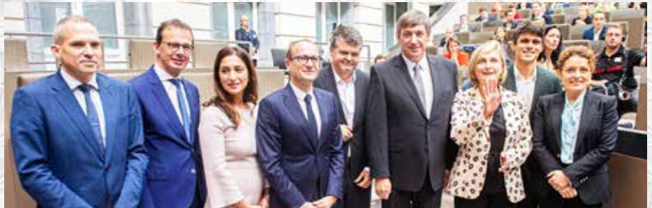
De nieuwe Vlaamse regering Jambon.

Hoera! In het Vlaams regeerakkoord is de stemplicht voor gemeentel- en provincieraadsverkiezingen gesneuveld. Daarmee verwezenlijkt de Vlaamse regering met Vlaams-Nationalisten, liberalen en christendemocraten, jawel, een belangrijk deel van de Burgermanifesten van Guy Verhofstadt.