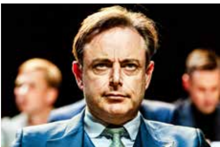
Vooraf N-VA-voorzitter Bart De Wever staat de komende weken voor moeilijke keuzes: al of niet in een federale regering stappen.

socialisten en de groenen. De optelsom van deze zes partijen geeft 76 op 150 zetels en geen Vlaamse meerderheid. Het eerste is wel een probleem, doch het tweede element is dat juridisch niet! Een probleem is dat een dergelijke coalitie te links is voor Open Vld. Voor de Franstaligen biedt deze paars-groene combinatie het voordeel van de overeenstemming met het Waals Gewest en de Franse Gemeenschap. Desalniettemin zal men toch wel een zevende partij moeten zoeken om deze zespartijencoalitie werkbaar te houden. Het Fransdolle Défi (2 zetels) is moeilijk verkoopbaar in Vlaanderen en hetzelfde geldt voor de franstalige christendemocraten van CDH (5 zetels). Trouwens dan moet Open Vld opboksen tegen N-VA, Vlaams Belang en CD&V.