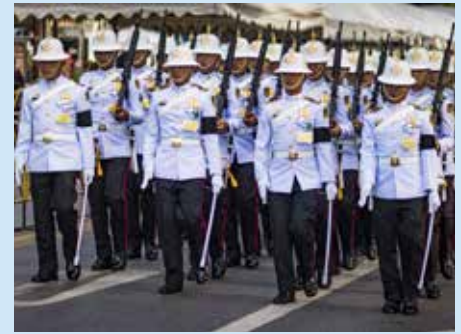
Het Thaise leger: een groot probleem door de blijvende greep op de politiek.

De wegdeemstering van het koningspaar kwam het leger goed uit. Huidig premier, generaal Prajoet Chan o-Cha, zal ongetwijfeld verguld zijn met kroonprins Maha Vajiralongkorn. Niet bepaald het evenbeeld van zijn vader, zijn autoritaire trekken zijn allesbehalve verborgen. Zijn scrupuleuze behandeling van vrouwen – hij heeft al drie echtgenotes versleten, vier zonen verbannen naar de VS, en acht familieleden laten opsluiten -, zijn min-