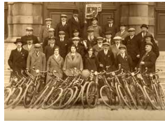
Wielrijdersbond "Het Blauwe Wiel" uit Antwerpen.

Naarmate sport aan maatschappelijk belang won, werd het ook een thema in de nationale politiek. Op de drempel van de 21ste eeuw organiseerde het LVV zelfs een apart con-