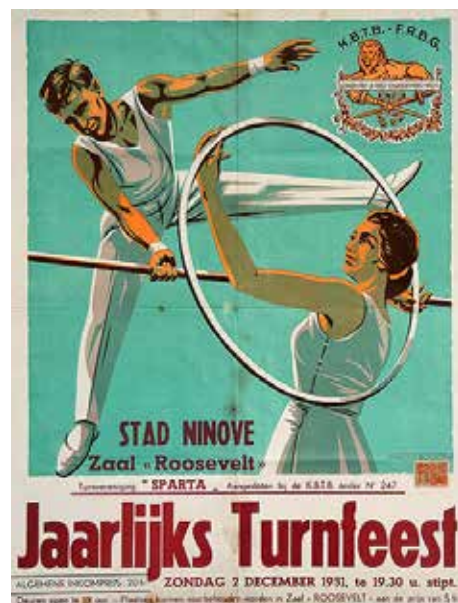
Dankzij de illustraties van vormgever Georges De Buyser (Geo) kreeg Sport '70 (een uitgave van Hoste-Het Laatste Nieuws) een aantrekkelijk uitzicht.

Cupérus en zijn turnbeweging waren in de jaren voor de Eerste Wereldoorlog ook promotor van de gedachte dat een goede lichamelijke opleiding in de jeugdijaren een goede voorbereiding was op de legerdienst. De campagne liep samen met het debat dat in die dagen werd gevoerd rond de invoering van de algemene dienstplicht. De eis hiervoor werd sterk gesteund door de liberale partij: het lotelingsysteem vond men onrechtvaardig. Of hoe sport en belangrijke maatschappelijke en politieke vraagstukken met elkaar verbonden zijn.