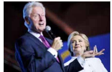
Ook voormalig president Bill Clinton speelt een voornamelijk rol in de campagne van Hillary.

Uiteindelijk stemmen op 8 november aantaande de geregistreerde kiezers van de 50 staten en het territorium Washington DC voor een nieuwe President. Maar vele staten stemmen al jaren voor dezelfde partij. Inderdaad Californië (55 kiesmannen) stemt al jaren democratisch, Texas