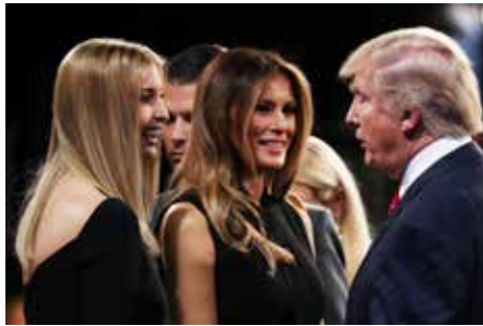
Donald Trump en zijn vrouwen, echtgenote Melania en dochter Ivanka: het "Bold and the Beautiful"-gehalte was nooit zo hoog.