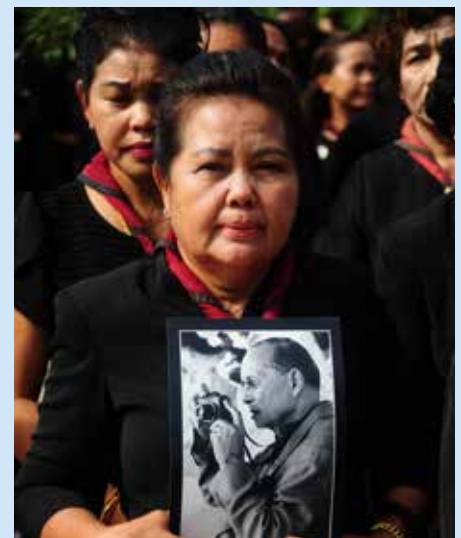
Rouwen om koning Boemibol: een goddelijk uithangbord dat niet mocht in vraag worden gesteld.

Toch is het eerder Sirikit die zich sociaal toonde. Verdraagzaamheid en opvang van vluchtelingen waren haar hoofddoelen. Zij heeft altijd een goede band onderhouden met het roerige zuiden van Thailand, waar vooral islamitische Maleiers wonen. Een opstandige beweging, de Barisan Revolusi Nasional (BRN), pleegt geregeld aanslagen in drie zuidelijke provincies die ooit het aparte koninkrijk Pattani vormden. Hoewel het een gemengd gebied is van boeddhisten, christenen en moslims, heeft Bangkok het hele gebied mismeeerd. Zo'n dertien jaar geleden verdween de mensenrechtenadvocaat Somchai Neelapaijit. Er is nooit een schuldige gevonden. Het leger werd ingezet om protesten te verhinderen, en onder