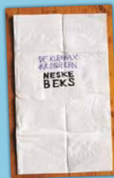
Neske Beks, De Kleenex Kronieken . Uitg. De Harmonie, Amsterdam, 2014; 243 blz.; 17,90 euro

In elk personage, en vooral in dit van de hoofdpersoon Priscilla schuilt een heimwee naar edel geluk. Maar de moderne samenleving en de haast onontkoombare vooroordelen t.o.v. een 'negerinnetje' slaan dat verlangen stuk of maken het tot een tragisch kwijnen. Ontroerend debuut, soms rauw en verbeteren, maar eerlijk, indringend geschreven en getuigend van medelijden met de medemens. Het is nu aan Beks om te bewijzen dat zij haar eigenzinnige weg kan vervolgen en ons verhalen en romans brengt die opvallen door hun vaart en stilistische precisie en met leesplezier dat van de pagina's spat. ■