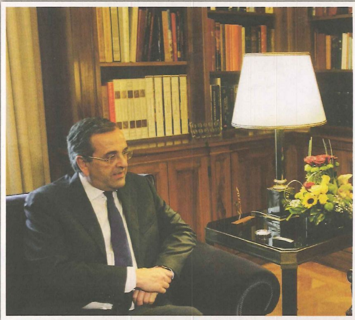
De Griekse eerste minister Andonis Samaras.

drie nieuwe categorieën die onder het juk moeten doorlopen: het onderwijs, de gezondheidszorg, de ambtenarij.