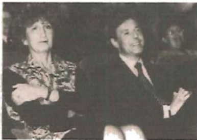
Jaarvergadering te Aalst