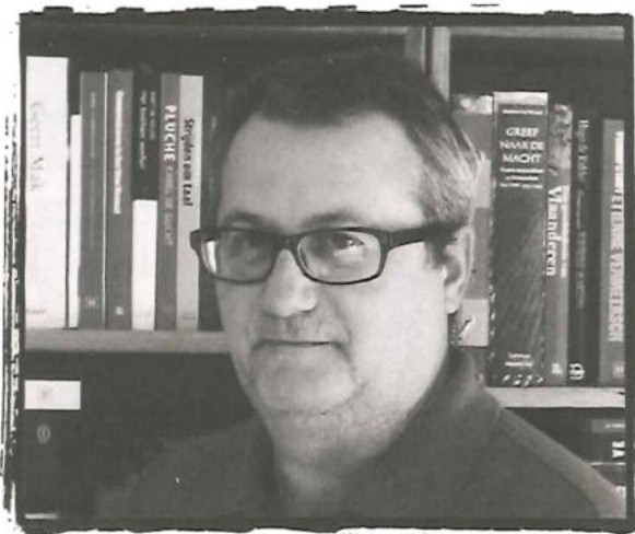
Van de redactie door Bert Cornelis