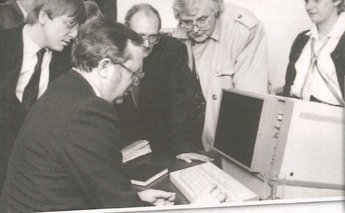
Wilfried Martens en Guy Verhofstadt bij de voorstelling van 'Bistel', de eerste computer op de Wetstraat 16. Op 20 oktober 1988 werd bekend dat "piraten" de Bistel-computer van Martens hadden gekraakt.