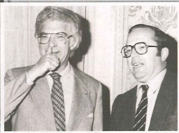
Willy De Clercq en Wilfried Martens.