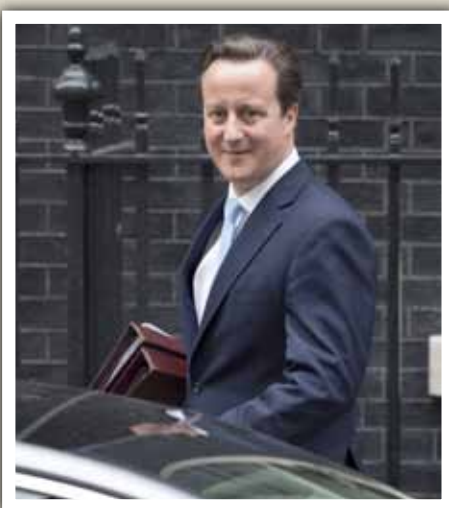
Kan de Britse premier David Cameron de Schotse onafhankelijkheid afwenden?