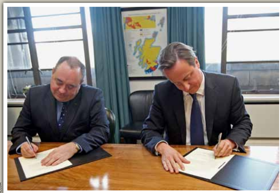
De Schotse eerste minister Alex Salmond en de Britse premier David Cameron ondertekenen het akkoord over de volksraadpleging.

De waarschuwing hielp niet. Geen tien jaar later, in juni 1314, versloeg Robert the Bruce de Engelse koning (Battle of Bannockburn) en maakte zijn land onafhankelijk. De roep om onafhankelijkheid is nooit gestild, ook niet na de personele unie onder James VI (1603) en de opheffing van het Schots Parlement in 1707. Die symboliek heeft de Schotse Nationale Partij (SNP) hoog in haar vaandel geschreven. Toen de SNP in 2007 de grootste partij werd en met de Groenen een minderheidscoalitie vormde onder de welbespraakte, voormalige petroleumeconoom Alex Salmond, werd de basis gelegd voor een vreedzame deling van het Verenigd Koninkrijk. Schotland had in 1998-9 zijn eigen parlement gekregen, de federalisering ("devolution", gestage