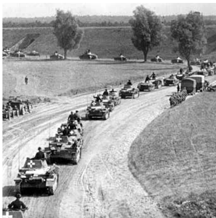
De Duitse invasie in Polen dreef het land naar de afgrond.

Dat komt omdat Polen met een foute inschatting is toegetreten tot de EU. Polen wou – net als de Baltische staten – in eerste instantie een militaire veiligheidskoepel: de NAVO. De rest zou wel volgen. Quod non. Angst voor de eigen spiegel. Anderzijds,