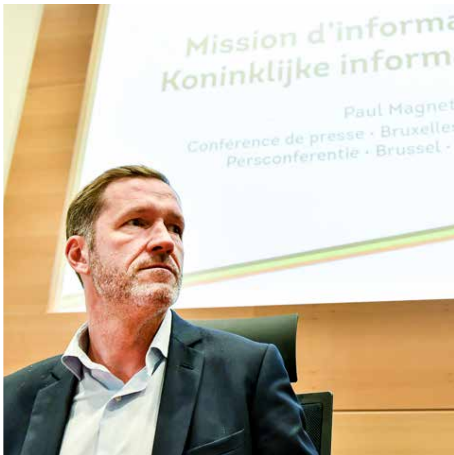
Informateur Paul Magnette.

“Het negativisme en pessimisme moeten plaatsmaken voor een begeistert project van partijen en mensen die begrijpen dat ze alleen door samenwerking over de partijgrenzen heen zaken in beweging zetten”