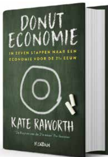
Kate Raworth, Donut Economie, uitg. Nieuw Amsterdam, Amsterdam, 2018; 352 blz.; 24,99 euro.

The Guardian noemde haar de nieuwe John Maynard Keynes, en je hoort ook zeggen dat ze een leesbare Piketty is. Beide stellingen zijn onwaar. Maar econoom Kate Raworth heeft met "Donut Economie – in zeven stappen naar een economie voor de 21e eeuw" een bestseller geschreven en een hype gecreëerd.