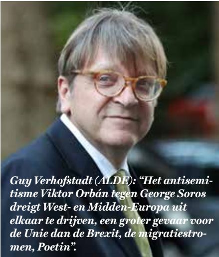
Guy Verhofstadt (ALDE): "Het antisemitisme Viktor Orbán tegen George Soros dreigt West- en Midden-Europa uit elkaar te drijven, een groter gevaar voor de Unie dan de Brexit, de migratiestromen, Poetin".

te integreren moet het veiligheids- en buitenlands beleid versterkt. Het blinde vertrouwen in anderen (zeg maar, de VS) is voorbij. Willen we als gemeenschap overleven, dan moet de EU haar lot in eigen handen nemen. Dat betekent: afstappen van eenparigheid waar mogelijk, binnen de verdragen; een eigen Europese veiligheidsraad oprichten om sneller te werken; een eigen leger om de vrede te handhaven, op de 100ste verjaardag van de Wapenstilstand na de 'Groote Oorlog'. Dat leger moet efficiënt zijn, want in de Unie bestaan er 160 wapensystemen. Ter vergelijking: de VS houden het bij een kleine zestig. Een heikele moeilijkheid evenwel blijft een overkoepelend en gemeenschappelijk beleid voor de wapenuitvoer.