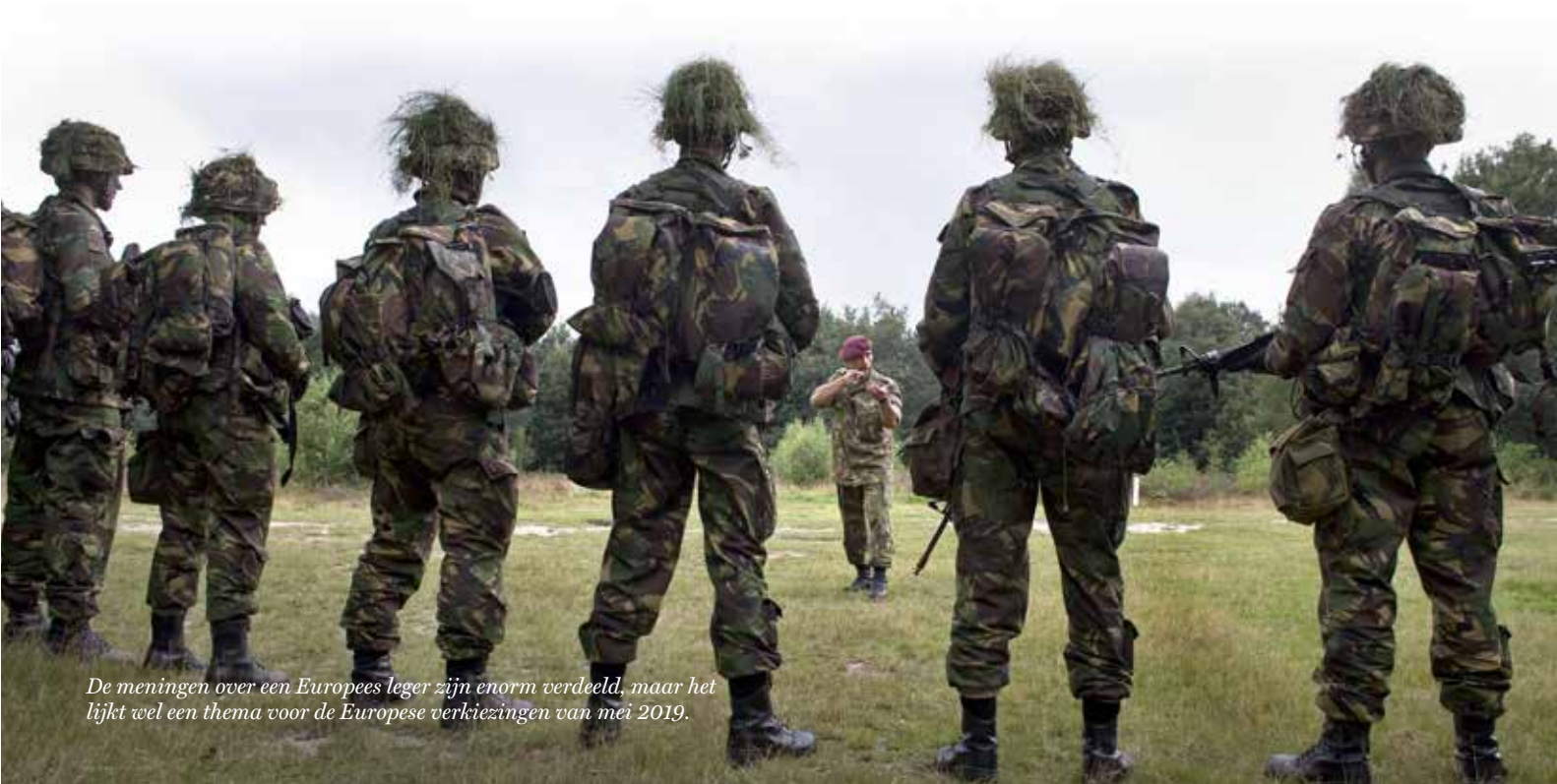
De meningen over een Europees leger zijn enorm verdeeld, maar het lijkt wel een thema voor de Europese verkiezingen van mei 2019.

Een Europees leger is zeker geen dwaas idee in deze turbulente mondiale tijden. Maar er zijn nog vele discussies niet gevoerd, namelijk: het afgeven van soevereiniteit, het budget en wie doet mee? Een gerelateerd gegeven is het feit dat een Europees leger ook alleen maar kan werken in het kader van een politieke unie. Dit laatste is al jaren een probleem, en zeker in het kader van de eurozone. •