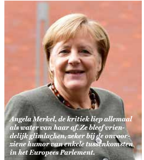
Angela Merkel, de kritiek liep allemaal als water van haar af. Ze bleef vriendelijk glimlachen, zeker bij de onvoorziene humor van enkele tussenkomsten in het Europees Parlement.

Pessimisme deelde Merkel duidelijk niet. “Verantwoordelijkheid is de opdracht van alle leden van de euroclub. Alleen met een gezonde muntpolitiek kan de euro functioneren zoals het hoort”. Ze wees op de andere troeven, zoals