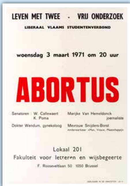
Affiche van het LVSFV Brussel, 1971. (collectie LA)

Kim DESCHEEMAEKER (Liberaal Archief/Liberas)