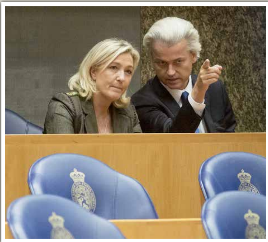
Marine Le Pen (FN) en Geert Wilders (PVV)

Europa groeit met de dag, de aanslepende gevolgen van de bankencrisis blijven kwaad bloed zetten, privacy-schendingen en de verharding van de samenleving drijven emotioneel reagerende burgers in handen van autoritaire partijen. Hoe atavistisch ze ook zijn, want hun engnationalisme en weinig solidair maatschappijmodel stamt al uit de 18e eeuw, en is niet meteen aangesneden op de globaliserende tendensen die de huidige samenleving bepalen. Het uiterst rechtse clubje deint uit: behalve FN, Vlaams Belang, FPÖ en PVV, leunen ook de Ware Finnen, de Zweedse Demokraterna, de Deense Folkeparti en het Poolse Recht en Rechtvaardigheid (PiS) nauw aan bij het geschetste, ultraconservatieve gedachtegoed. Voorlopig Niet-Ingeschrevenen (die zich “tweederangsverkozenen” voelen in het EP, omdat zij niet kunnen genieten van allerhande voordelen als betoelaging, agenda-inspraak, mandaten of plenaire vragen) uit kleinere landen (Litouwen, Bulgarije, Slowakije, Kroatië, Malta) of uit minderheids-groepen (Italië – wat met de Vijfsterrenbeweging van Beppe Grillo ?; Roemenië – de