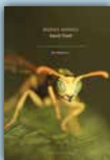
David TROCH, buiten westen . Uitg. Poëziecentrum Gent, 2013 (tweede druk), Bel-etagereeks; 46 blz.; 17,50 euro.

Misschien is (wordt?) Troch een zuiver humanistische en sentimentele dichter, wat helemaal niet als minderwaardig beschouwd dient te worden.