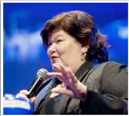
Congresvoorzitster Maggie De Block.

structuren, maar de mensen gefinancierd. Bestrijding van sociale en fiscale fraude is een prioriteit. Zwartwerk wordt ingedijkt met flexi-jobs.