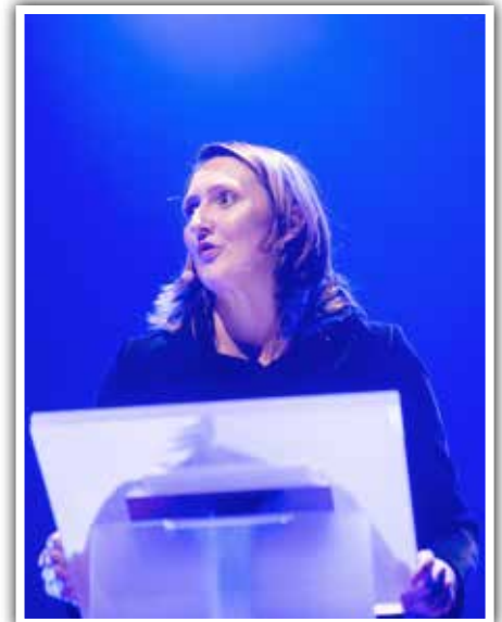
Open Vld-voorzitster Gwendolyn Rutten.

Het zijn maar enkele voorbeelden waaruit blijkt dat de Vlaamse liberalen voor een sociale inslag gekozen hebben in hun toekomstverklaring. Open Vld is er in geslaagd om vanuit de eigen kracht een aantal liberale principes op scherp te stellen. Dat is nodig voor de komende campagne waarin de kiezer het verschil met andere partijen moet kunnen maken. Het begrip liberalisme is opnieuw omschreven als een levensvisie waarbij het individu centraal staat met zijn individuele rechten, zijn welzijn, zijn vrijheid. Niet de natie, niet het volk, niet de groep zijn belangrijk, maar wel de mens in zijn volle “mens zijn” zelf. Open Vld heeft op enkele uitzonderingen na (de wat naïeve participatiesamenleving, de afschaffing van de provincies, de samensmelting van gemeenten en OCMW's, de Kamer-