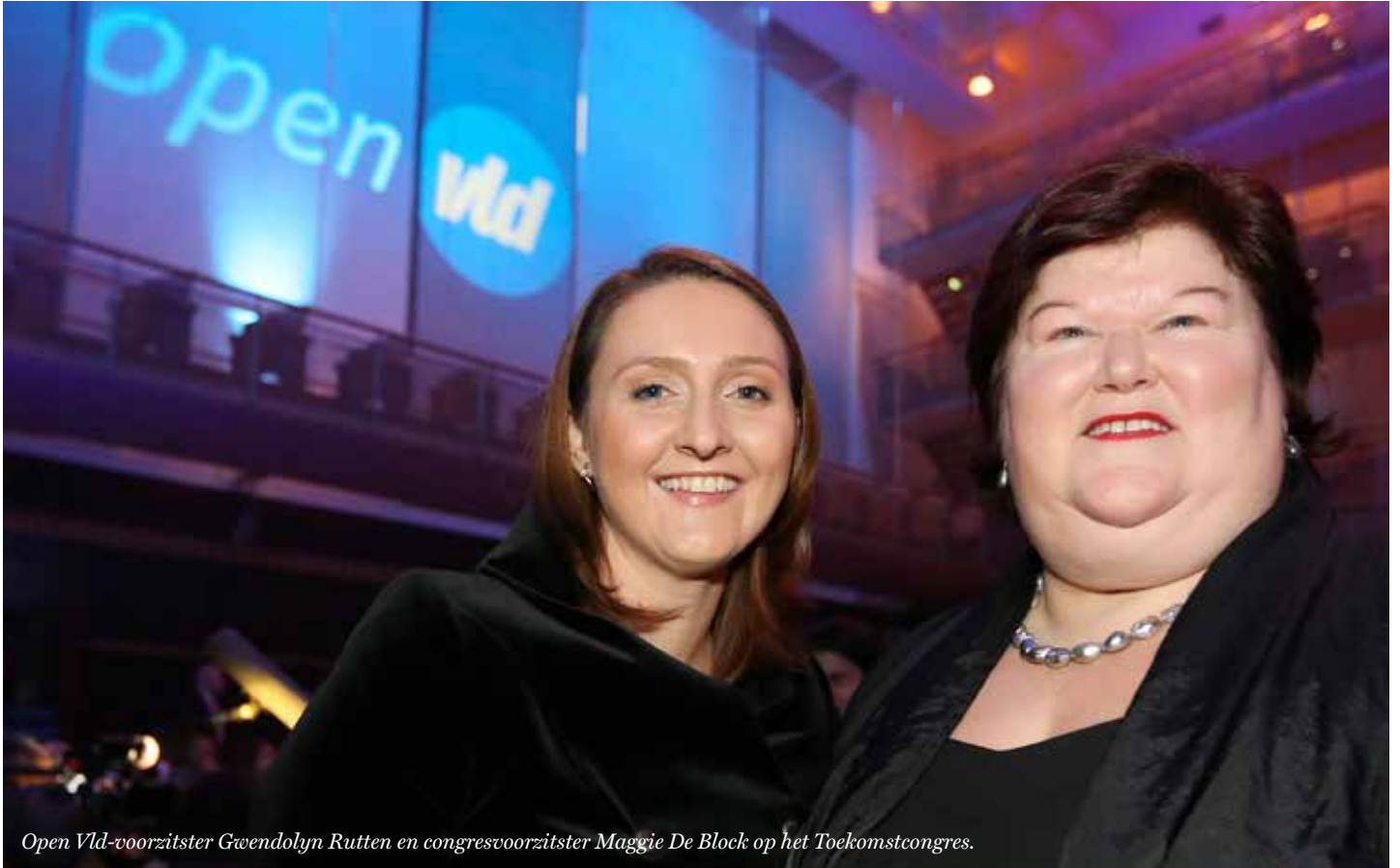
Open Vld-voorzitster Gwendolyn Rutten en congresvoorzitster Maggie De Block op het Toekomstcongres.

nr 09 - November 2013 Jaargang 134 maandblad