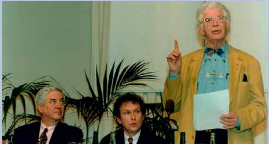
Willy De Clercq in 1994 op een LVV-congres in Brugge, samen met LVV-voorzitter Clair Ysebaert en Frits Bolkestein.