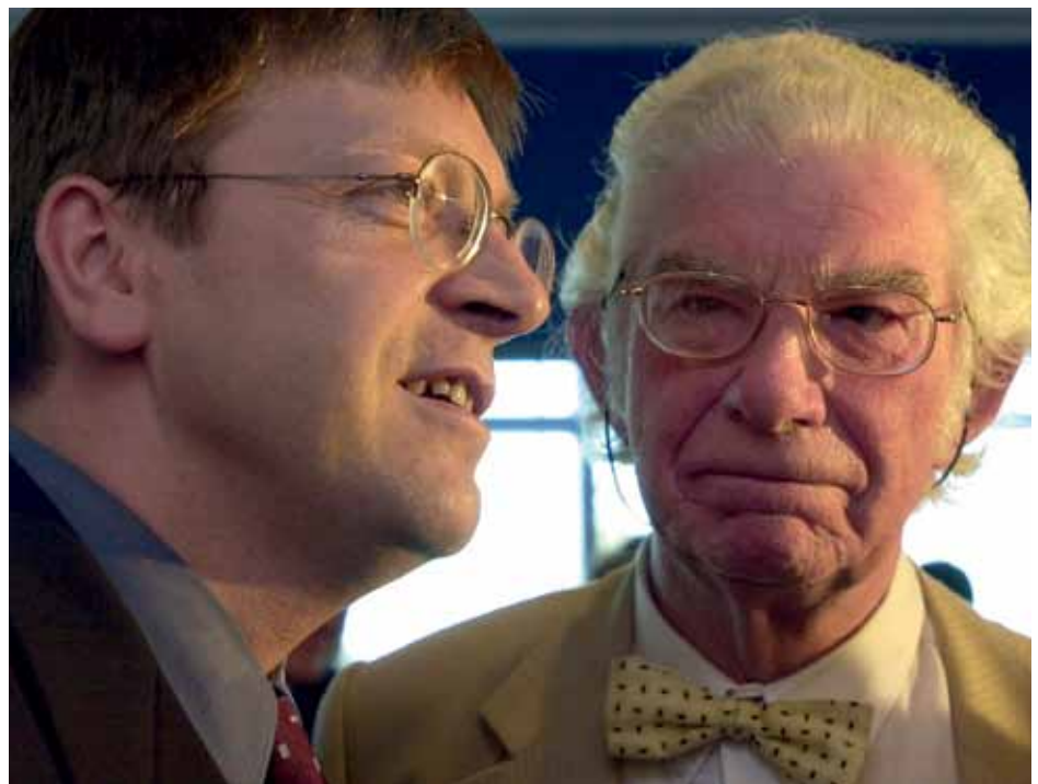
Met Guy Verhofstadt, zijn politieke zoon.

"Ja. Niemand, ook ik niet, had er nog aan gedacht dat ik de eed moest afleggen. Tot plots tijdens de eerste zitting die ik meemaakte, voorzitter Camille Huysmans mij vroeg om de eed af te leggen. Zonder dat iemand er meteen erg in had, legde ik de enige eed af waarvan ik de formule kende. Ik had trouwens niet veel tijd om na te denken. Het bleek de