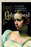
GALGENMEID door Jean-Claude van Rijckeghem en Pat van Beirs, 2010, uitg. Manteau/WPG Uitgevers, 496 pagina's