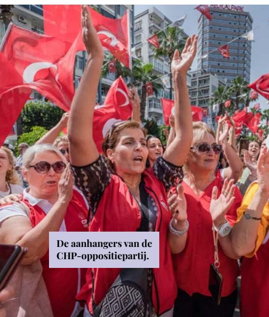
De aanhangers van de CHP-oppositiepartij.

Ik kan de Turken alleen de raad meegeven van Kemal Atatürk zelf: "Er bestaan geen hopeloze situaties, er bestaan alleen hopeloze mensen".