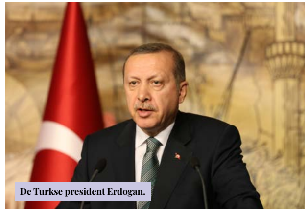
De Turkse president Erdogan.

Par. "Hüda Par, het verlengstuk van Hezbollah dat de sjaria wil opleggen, verwerpt alle vrouwenrechten". Het partijtje kon profiteren van Erdoğan's groothartigheid (niet zonder bijbedoelingen): hij heeft de kiesdrempel verlaagd van 10 % naar 7 %. "Hüda Par heeft