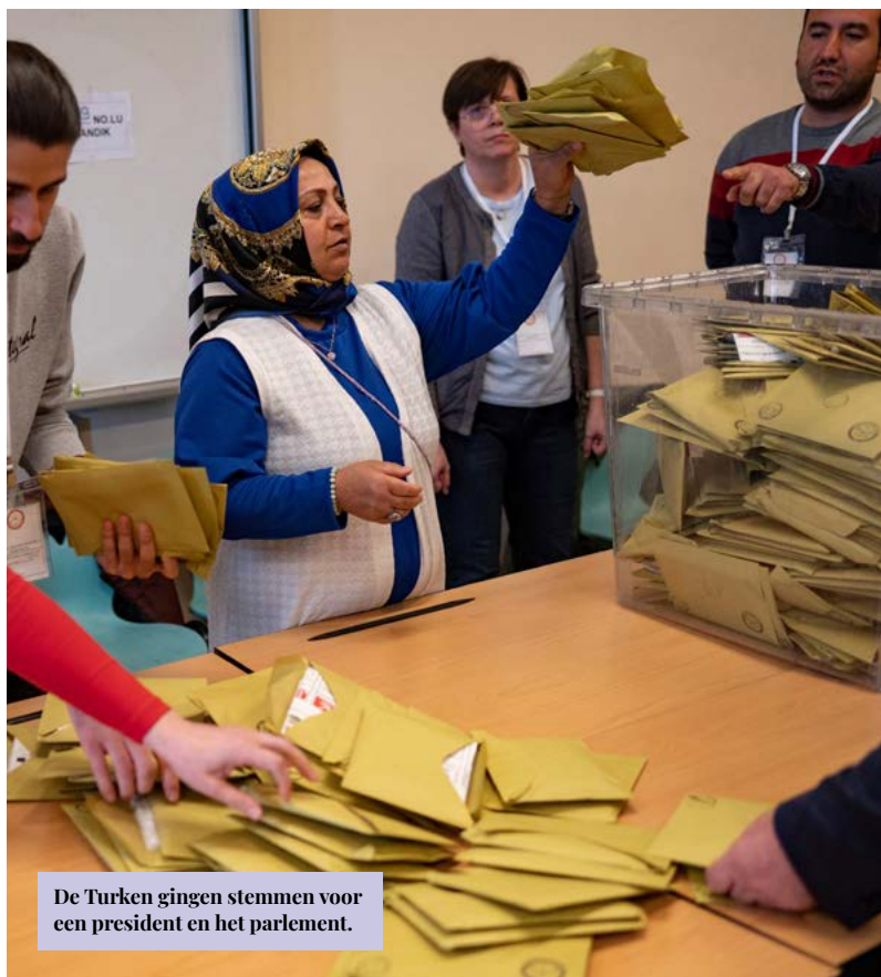
De Turken gingen stemmen voor een president en het parlement.

Wie de cijfers, niet alleen economisch, maar ook de vrijheden bekijkt, ziet hoe diep het land gezakt is. Freedom House analyseert jaarlijks de vrijheden en hun inperkingen in de hele wereld, 208 landen en territoria (zoals bezet Tibet of de Gazastrook bijv.). Turkije