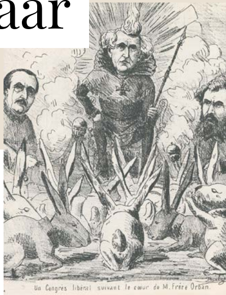
Negentiende-eeuwse karikatuur van de wijze waarop Walthère Frère-Orban als onbetwist leider volgzzaamheid vraagt op partijcongressen.

In de zomer van 1919, na de invoering van het algemeen enkelvoudig mannenstemrecht, riep de Landsraad een nieuw partijcongres bijeen. Tijdens het eerste naoorlogse congres stelde de partij zich op als een nadrukkelijke tegenstander van een snelle invoering van het vrouwenstemrecht, zelfs op het gemeentelijke niveau. De congresresoluties bepleitten naast een fiscale hervorming en aanmoediging van werkgevers- en werknemersorganisaties de instelling van een gewaarborgd minimumloon en een maximale arbeidsduur zodat arbeiders voldoende vrije tijd kregen.