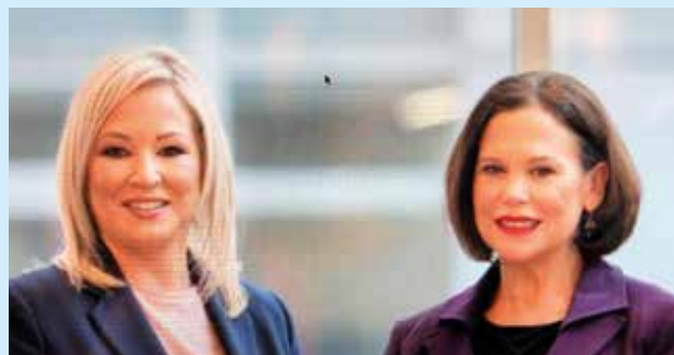
Worden Michelle O'Neill (rechts) en Mary Lou McDonald straks de boegbeelden van Noord-Ierland?

Belfast, Europahotel, het meest gebombar-