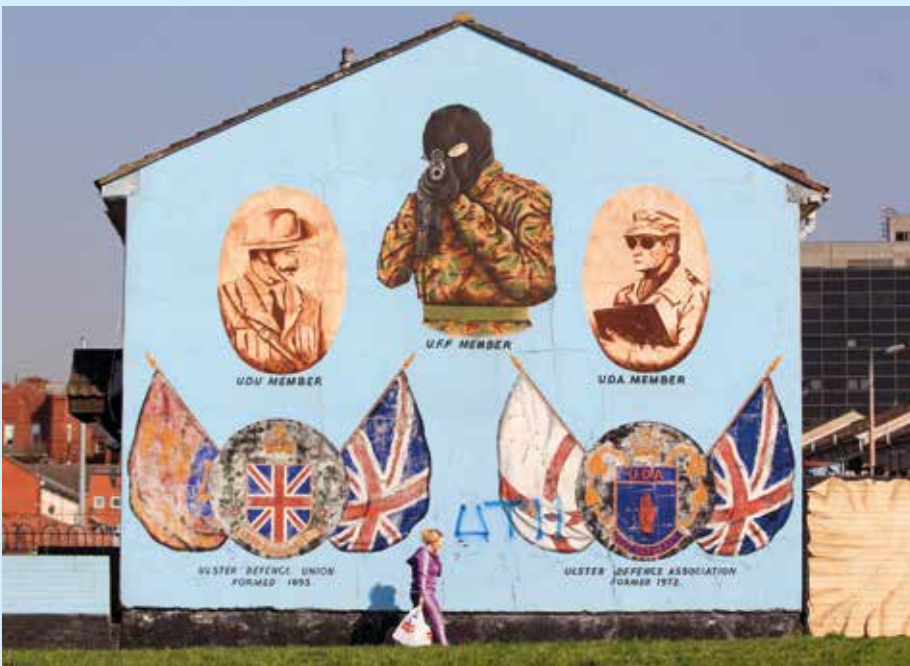
Noord-Ierland was jarenlang het toneel van oorlog en terreur.

Carlingford, dampig hotel. Een koppel uitzinnig kwaad. "Vuile Britten, praaien ze ons jacht. Alsof we misdadigers zijn." Newry, ik steek de grens over, er zijn nog strakke controles. Stop, vraag naar de luitenant. Of ik foto's mag maken? "Had je organisatie vooraf moeten aanvragen." Pas in Dublin merk ik dat de film uit mijn foto-apparaat inmiddels verwijderd werd.