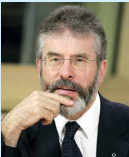
De voormalige Sinn-Féin-leider Gerry Adams sliep elke dag ergens anders.

Coalisland, streek van de door het Britse leger en de UDA-militie vermoorde activiste Bernadette Devlin. Afspraak in een achterkamertje van de pub. Onder de dreigende schaduw van het versterkte politiekantoor. Nauwelijks verstaanbare jongeman toont de striemen en wonden van zijn mishandeling door de politie.