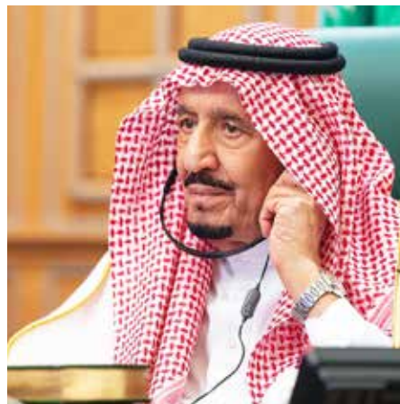
Kroonprins Mohammed bin Salman liet zich door de bedreigingen van de Amerikaanse president Trump niet afschrikken.

een eigen bestuur in het leven geroepen op 25 april. Maar niet alle stamhoofden zijn daarvan gediend. Bin Salman houdt het been stijf, en paait het Westen met een offensief tegen de oerconservatieve geestelijken. Dat Corona de hadj, de pelgrimstocht die elke moslim eens in zijn leven verwacht wordt te doen naar Mekka en Medina, heeft platgelegd is in zijn voordeel. Grote rampen of rellen zijn dit jaar uitgesloten.