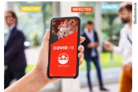
Een app op de smartphone, die automatisch zou bijhouden met wie we contact hebben, is een te onderzoeken optie.