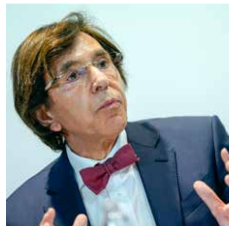
De Waalse minister-president Elio di Rupo zoekt een omwegje om wapens aan Saoedi-Arabië te leveren.

Di Rupo had wel geweigerd een levering aan de Saoedische luchtmacht te blokkeren – logisch, gezien de oorlog in Jemen, waar die luchtmacht burgerdoelen en ziekenhuizen bombardeert. Jemen is een volstrekt kunstmatige staat. Noord-Jemen, een voormalig Ottomaans wingewest, was tot 1990 een orthodox islamitisch koninkrijk, gesteund door Saoedi-Arabië. Zuid-Jemen, het vroegere Britse protectoraat Aden, riep zich uit tot Volksrepubliek in 1967 en werd twee jaar later communistisch. Sinds de hereniging is het er nooit rustig geweest, maar ironisch genoeg is nu het Noorden in sjiiitische handen, en het zuiden conservatief. De Saoedische bemoeienis was een gevolg van de ambities van kroonprins Mohammed bin Salman. De actieve politiek van Bin Salman heeft economische, geopolitieke, humanitaire en socio-culturele gevolgen.