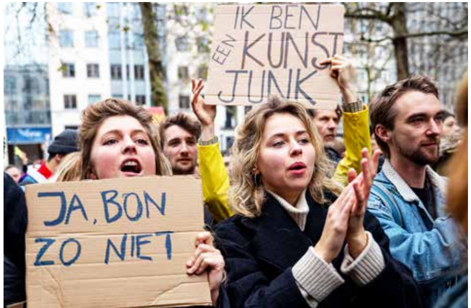
De cultuursector kreeg voor de coronacrisis al klappen van de Vlaamse regering. Wie helpt hem om de achterstand in te halen?

De cijfers die circuleren, zeggen alles: 360 gemiste premières, in binnen- en buitenland, alleen al Vlaamse producties, 2.600 geannuleerde speeldagen, 170 tentoonstellingen met Vlaamse kunstenaars geschrapt,