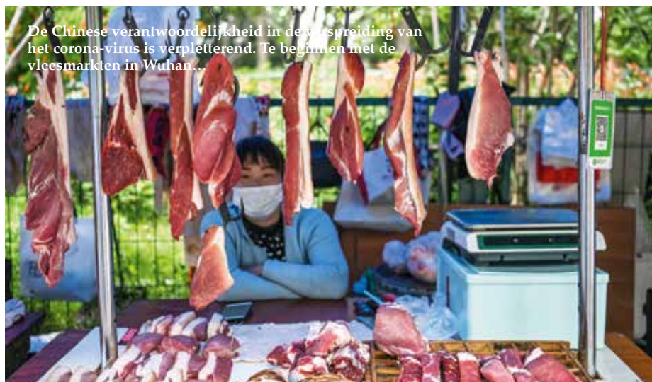
De Chinese verantwoordelijkheid in de verspreiding van het corona-virus is verplefferend. Te beginnen met de vleesmarkten in Wuhan...

Een systeem van manuele contactopsporing werd van kracht. Iedereen die positief test op COVID-19 of contact heeft gehad met een besmette persoon, wordt nu thuis opgebeld. Maar het contact kan ook aan huis gebeuren voor mensen die geen telefoon hebben en blijkbaar zou deze informatie niet