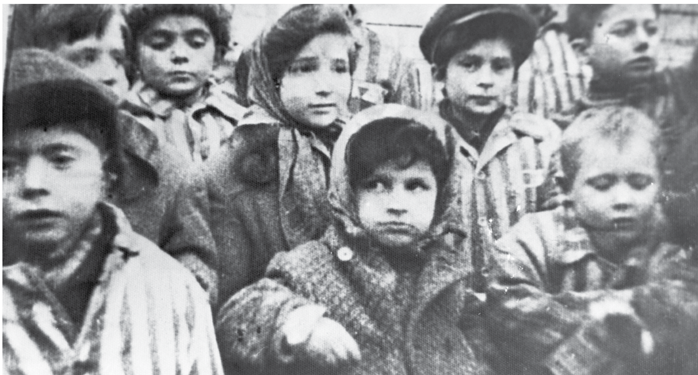
Kinderen na de bevrijding van het concentratiekamp van Auschwitz.

Jaargang 132 - nummer 4 - mei 2011 - maandblad