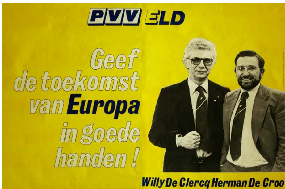
Affiche uit de campagne Europese Verkiezingen 1979. Op de site van Liberis zijn naast affiches ook gedigitaliseerde verkiezingsfolders terug te vinden.

parlement dat eigenlijk nog niets te zeggen had. Hij was weinig optimistisch. "De Europese beweging heeft lood in de zwakke vleugels," aldus Grootjans. Ook andere Europese landen worstelden hiermee. 'Hast Du einen Opa, schick ihn nach Europa', aldus een veelzeggende slogan die in Duitsland de ronde deed. In een ander commentaar in 'De Nieuwe Gazet' zag een meer positief ingestelde Piet Van Brabant wel de voordelen van een gezamenlijk Europa, vooral om grensoverschrijdende problemen zoals de energiecrisis, werkloosheid, ecologische risico's, enzovoort, aan te pakken.