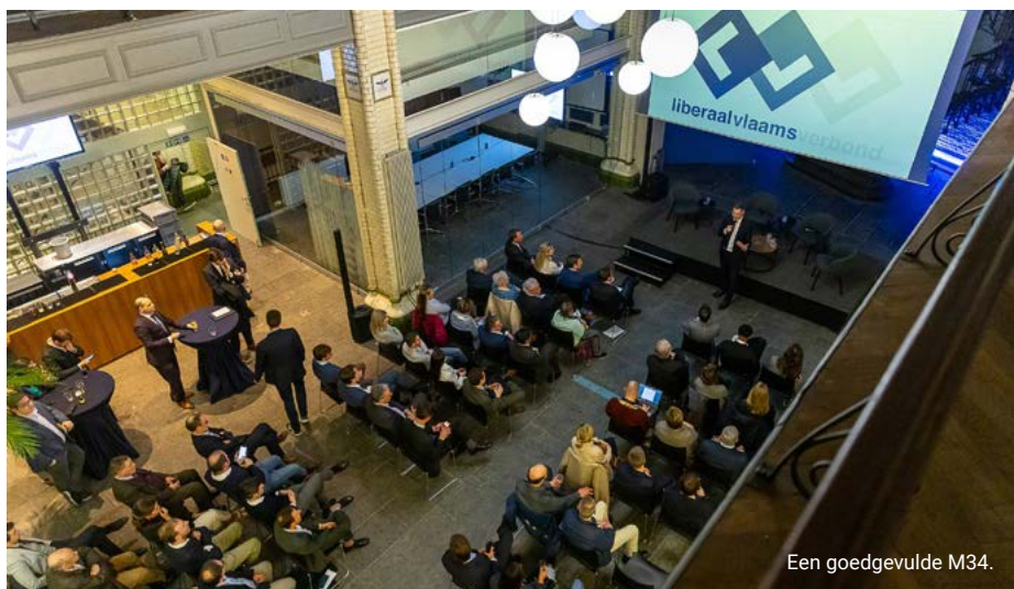
Een goedgevulde M34.

Daarnaast voeren we een fiscale hervorming door de lasten op arbeid drastisch te verlagen, zowel voor werknemers als voor werkgevers, en