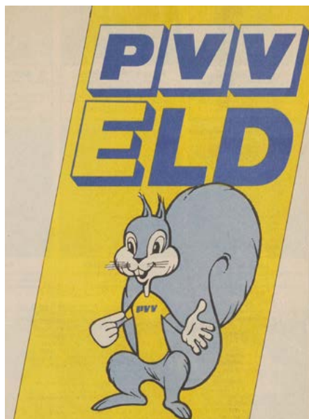
De PVV-eekhoorn transformeerde voor de gelegenheid in een ELD-PVV-mascotte.

De gemiddelde burger bekeek dit alles met wat minder enthousiasme en zag de Europese verkiezingen vooral als een verloren zondag. Het ontging gewezen PVV-partijvoorzitter Frans Grootjans niet. In een editoriaal in 'De Nieuwe Gazet' wees hij erop dat de kiezer moe was om nog maar eens naar de stembus te gaan, een uitslag neer te zetten die dan toch niet werd gevolgd (de Belgische formatie lag duidelijk nog op de lever), en dat voor een