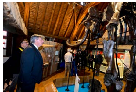
Vlaams minister-president Jan Jambon bij de mammoet van Dendermonde.

Maar ergerlijker is wat er werkelijk achter initiatieven als Faam schuilgaat; het boetseren van een Vlaamse identiteit door de Vlaams-nationalisten. In 2019 maakte Bart De Wever het als N-VA-voorzitter tijdens de regeringsonderhandelingen al duidelijk dat het verleden in dienst moet gesteld worden van zijn toekomstvisie en de uitbouw van een Vlaamse natie. Hij schreef er ook een boek over, ‘Over identiteit’. Daarin lezen we dat identiteit nooit individueel kan ontstaan maar steeds een groepsverbondenheid noodzakelijk acht. Niet het individu is belangrijk, maar de groep, de gemeenschap, in dit geval ‘de Vlamingen’. Wat natuurlijk veel zegt over de vrijheid van dit individu in dat geval. Hij of zij wordt als het ware verplicht om zich tot een gemeenschap