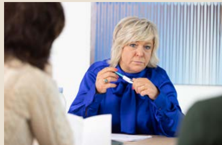
Hilde Vautmans (Open Vld)

Botenga had een dergelijke redenering al eind februari getackled. Er is nooit geld, behalve als het om wapenaankopen gaat, betoogde hij. België heeft een begrotingsgat van ruim 30 miljard, maar de Unie geeft vlotjes 50 miljard aan Oekraïne. “Waarom is er altijd geld voor