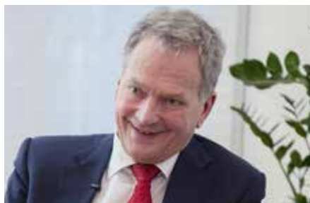
De Finse president Sauli Niinistö.

“Beware the Ides of March” . Het valt te hopen dat de Finse regering Shakespeare grondig gelezen heeft. De nacht van de volle maan betekent onheil, zoals Julius Caesar in 44 voor Christus mocht ondervinden. De centrumrechtse regering van Juha Sipilä heeft niet op die fatidieke datum gewacht en een week eerder ontslag genomen, op 8 maart. Op vraag van president Sauli Niinistö (tot zijn aantreden als staatshoofd in 2012 voorzitter van de Nationale Coalitiepartij Kokoomus) handelt hij de lopende zaken af tot er een nieuwe regering is. Dat kan snel gaan, want op 14 april (één dag na de Iden van April) houdt Finland nieuwe verkiezingen voor het éénkamerparlement, de Eduskunta of Rijksdag.