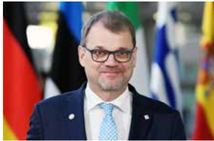
Voormalig Fins premier Juha Sipilä.

Sipilä heeft zich, als IT-miljonair, te nadrukkelijk op zijn economisch en financieel welslagen georiënteerd. Finland stond met