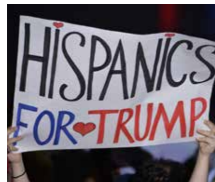
Een voordeel voor Donald Trump? De verkiezingen van 2016 hebben voor het eerst betrekking op een electoraat dat voor bijna een derde bestaat uit minderheidsgroepen.

met de dictaten van de partij en komen massaal opdagen in de primaries om te stemmen voor de anti-partijestablishment figuur. Tevens is het succes van Trump te relateren met zijn 'out of the box'-campagne en het feit dat hij zijn campagne zelf financiert. Al de andere kandidaten zijn afhankelijk van donaties en diens voorwaarden. Trump heeft ook belangrijke 'endorsement' gekregen met o.a. de steun van de gematigde gouverneur van de staat New Jersey: Chris Christie (1962, katholiek), de gewezen kandidaat dr. Ben Carson (1951, adventist) etc. Met Trump komt er opnieuw een traditioneel republikeins thema naar voren: economisch protectionisme (bijv. invoer staal) en een minder actief optreden in het buitenland. Als niet-kandidaat van de partij gelijkt hij op Reagan in 1980, die uiteindelijk de partijman Bush meenam als running mate.