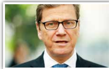
Voormalig Duits minister Guido Westerwelle: ook hij had ingezien dat de Irakoorlogen met Amerikaanse waan en bedrog waren uitgelokt.

En dat soort Europa, een “Duitsler Europa”, verdedigt Kaplan als hij liefst Duitsland in het zadel ziet zitten, ook al weten we dat Berlijn als allereerste het stabiliteitspact van 1997 aan zijn zolen lapte, en vrolijk over het 3% begrotingstekort hupte (net als Parijs trouwens), ook al weten we dat de Duitse auto-industrie meeschreef aan de richtlijnen over de luchtvervuiling (het beruchte “Porsche-amendement”), ook al hebben we gezien dat Merkel haar eigen koers voer over energie en vluchtelingen met niet-overlegde gesprekken