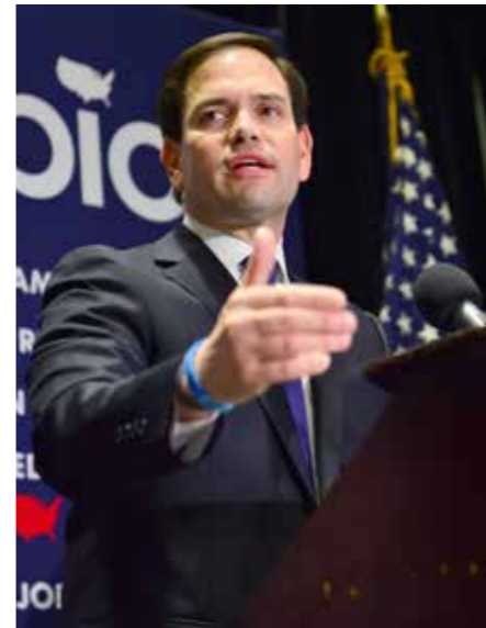
Marco Rubio: halve lieveling van het republikeinse partij-apparaat moest het onderspit delven.