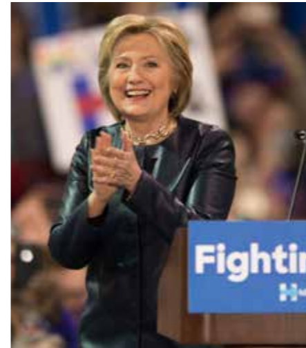
De democratische kandidaat Hillary Clinton: bekwam, maar het prototype van de partijmacht.

Inderdaad de revelatie van deze campagne is de vastgoedmiljardair uit NYC: Donald Trump (1946, Presbyteriaan). Opvallend is wel dat Trump zowel wint in conservatievere - als in liberale staten. Kortom de partijleden van de GOP (Grand Old Party) hebben het wel gehad