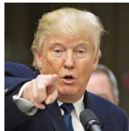
Meer dan tweederden van het republikeinse kiespubliek heeft in opiniepeilingen aangegeven dat zij nooit zullen stemmen voor “the Donald”.

Alternative voting of preferentieel stemmen houdt in dat de kiezers in de eerste en enige ronde de kandidaten moeten ordenen volgens hun voorkeur. Tot zolang niemand van de kandidaten meer dan 50% van de stemmen behaalt op basis van de eerste voorkeur van de kiezers wordt telkens de kandidaat met de laagste score geëlimineerd. Vervolgens wordt de “tweede keuze” van de kiezers van de geëlimineerde kandidaat opgeteld bij de resultaten van de “eerste voorkeur” van