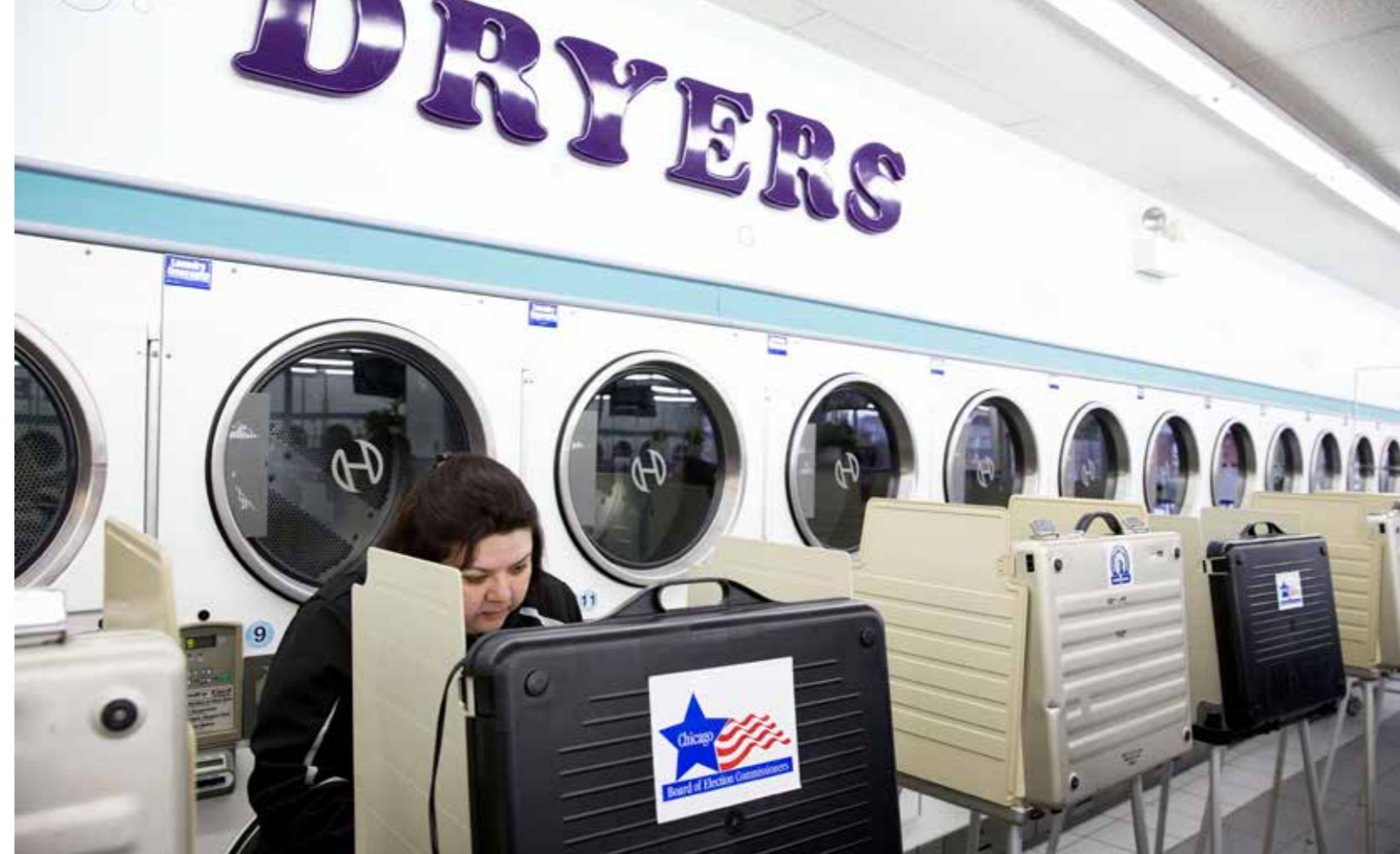
Zoals elke rechtgeaarde burger weet is democratie meer dan het aanvinken van een bolletje in een stemlokaal.

de andere kandidaten. Dit spelletje van eliminatie en herverdeling van tweede keuzes blijft doorgaan tot één van de overblijvende kandidaten de absolute meerderheid haalt. Door reeds bij de eerste stemming je voorkeurslijst op te stellen wordt vermeden dat kiezers verschillende keren naar de stembus moeten trekken en wordt meteen een virtuele tweede, derde of vierde ronde georganiseerd.