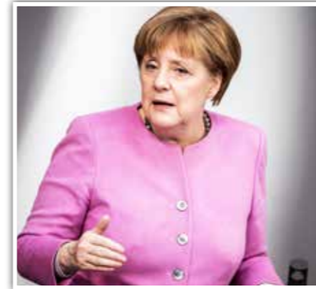
Angela Merkel: haar luisterbereidheid en onwrikbaarheid moet de kloof tussen burger en elite overbruggen. En daar zal ze in slagen.

in Moskou en Ankara, ook al weten we dat de vluchtelingendeal (doorgedrukt door Merkel) met het autoritaire Turkije van Erdogan geen ene moer geeft om democratische waarden, eerbied voor de rechtsstaat, of respect voor de grondrechten. Realpolitiek is Regalpolitiek geworden. Een rek, een schap waarop je je behoeftigheden schikt zoals je wil.