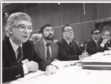
De oude garde...

Reeds in Volksbelang van september 1979 kondigden de PVV-jongeren hun intenties aan: “... een échte vrije mededinging, wat een afwijzing inhoudt van elke economische machtsconcentratie zij weze van private of publieke aard. Verder zijn wij ervan overtuigd dat de liberale maatschappijvisie die wij van de 18de en van de 19de eeuw hebben geërfd gemoderniseerd moet worden in de zin van de grotere participatie van het individu aan het economisch en politiek beleid van de samenleving waarin hij leeft. Hoe radicaal deze maatschappijvisie moet zijn, zullen het Bureau en het Politiek Comité dienen uit te maken. In hoeverre de P.V.V. zich deze principes