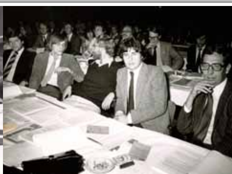
De jonge garde...

zal eigen maken zal verder afhangen van de overtuiging waarmee wij ons alternatief op het Congres van Kortrijk zullen verdedigen en van de ernst waarmee wij dat Congres zullen voorbereiden.” Niemand kon dus beweren dat ze van niets wisten en/of in snelheid waren gepakt.