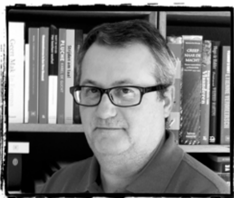
Van de redactie door Bert Cornelis