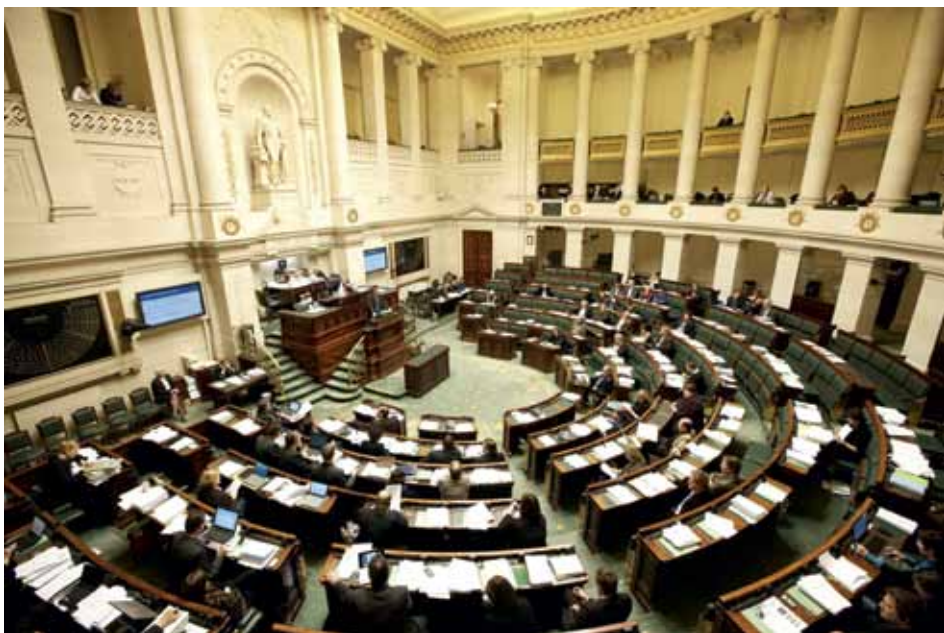
Een nieuwe staatshervorming op basis van het Nationaal Congres van 1830.

Eigenlijk moeten we nu tot een heel nieuwe en grondige staatshervorming komen. Lang werk dus voor een nieuw modern "Nationaal Congres" of "Staten-Generaal". Maar dat is gewoon niet mogelijk indien men dit wil realiseren voorafgaand aan een regeringsovername.