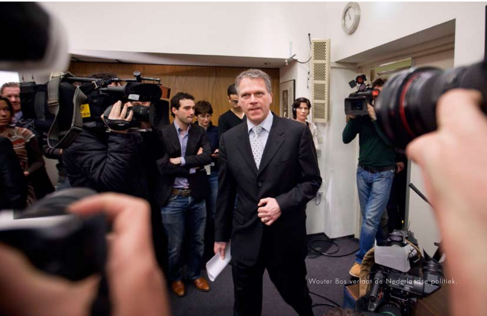
Wouter Bos verlaat de Nederlandse politiek.