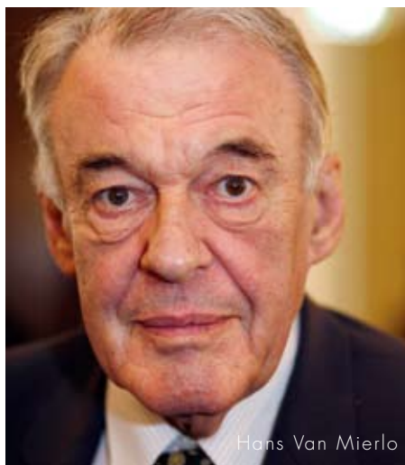
Hans Van Mierlo

Eerst bedankte Agnes Kant van de Socialistische Partij voor de eer. Na de gemeenteraadsverkiezingen was de SP verschrompeld tot een schim van wel- eer, toen Marijnissen nog alle registers opentrok – en zich daarna terugtrok. “Effe dimmen” past hij ook op zichzelf toe. Dan gaf Hans Van Mierlo, stichter, bezieler, en gezicht van D’66 voorgoed de geest. In dezelfde week bedankte Wouter Bos voor de eer om de nieuwe minister-president van Nederland te worden, in de veronderstelling dat de PvdA inderdaad de grootste wordt. Een