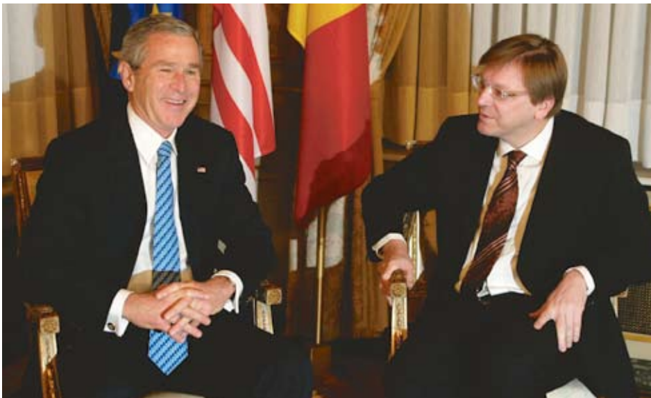
Februari 2005: Toenmalig premier Guy Verhofstadt ontmoet toenmalig president George Bush wiens Irakbeleid hij zwaar op de korrel had genomen.

Dat werd diplomatiek onhoudbaar, België leek op de keizer-koster van het wereldgeweten, de dominee voor alle mogelijke onvrede en afrekeningen. Toch hield Verhofstadt aanvankelijk vast aan die wet. Als verslaggever van de Rwandacommissie in de jaren 1990 was hij diep onder