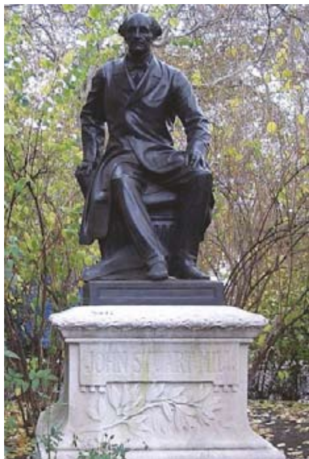
Temple Gardens, Victoria Embankment, London, van de hand van Thomas Woolner

Die idealen staan de voorbije jaren opnieuw onder druk. Fundamentele liberale grondrechten zoals de vrijheid