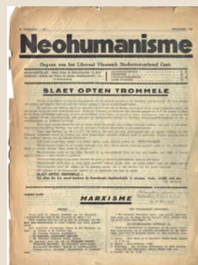
Voorpagina van het eerste nummer van Neohumanisme , december 1936.