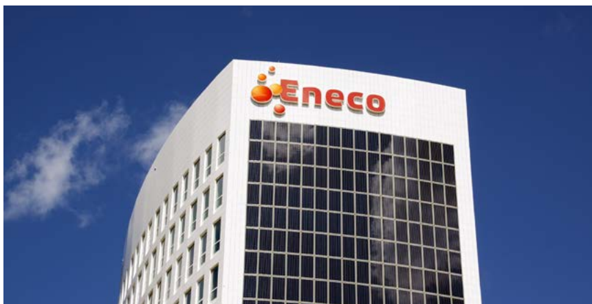
Het elektriciteitsnet zal moeten versterkt worden.

Netcongestie kan snel een probleem vormen op bedrijventerreinen, waar een groot deel van onze bedrijvigheid plaatsvindt. Net voor die plekken ontbreekt vaak een geïntegreerd beleid en worden veelal ad-hocbeslissingen genomen. Op