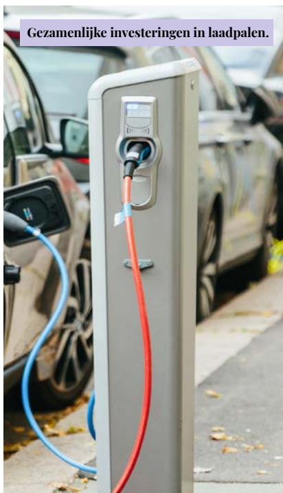
Gezamenlijke investeringen in laadpalen.