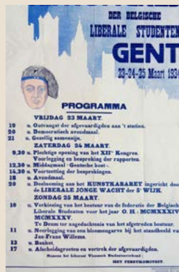
Affiche voor het twaalfde congres van Belgische liberale studenten in 1934 in Gent, georganiseerd door het LVSF.

Dit artikel is een bewerking van de tekst Kim Descheemaeker, "Slaet opten trommele" gepubliceerd op Liberas Stories ( www.liberasstories.eu )