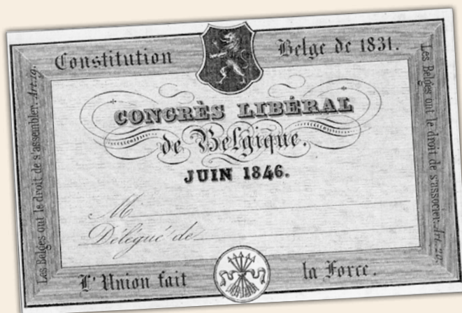
Een toegangkaart voor het Congres van 14 juni 1846.

Iets na negen uur openen de debatten onder leiding van Eugène Defacqz. Deze raadsheer bij het Hof van Cassatie beschikt over een indrukwekkende staat van dienst als jurist, politicus en vrijmetselaar. In zijn inleidende toespraak heeft hij het onder meer over het overwicht van de clerus op de openbare macht. Hij bepleit de geest van de jaren 1830 voor de grondwet als richtinggevend baken. Er komt een plan tot de algemene samenvoeging van alle liberale groepen op tafel. De bespreking sluit af met het goedkeuren van negen congresresoluties. De grondslag van de liberale partij is gelegd. Het goedgekeurde programma somt zes kernpunten op: kieshervorming, onafhankelijkheid van de