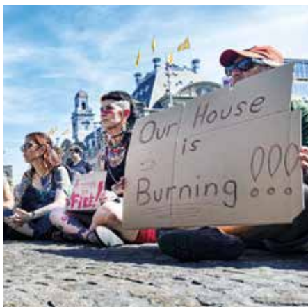
Er is heel wat protest tegen het beleid van de Braziliaanse president Bolsonaro en de bosbranden in het Amazonegebied.

Van lieverlede zoeken de garimpeiros andere oorden op, en dat pakt slecht uit voor de inheemse indianen en de quilombolas (afstammelingen van gevluchte zwarte slaven). De Federale Rekenkamer mag dan duizenden infrastructuurprojecten hebben stilgelegd, amper 1% gebeurde om milieuredenen. De parlementaire afschaffing van de milieubeschermdende maatregelen hebben de deur opengezet voor avonturiers in de 'reservaten'