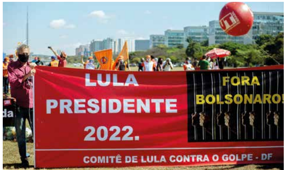
De roep voor een andere president in Brazilië is groot: Lula is de uitdager van Bolsonaro.

van de indianen. Het aantreden van Bolsonaro had al op twee jaar tijd gezorgd voor een versnelde ontbossing met 50%, in 2019 luidde de katholieke kerk de alarmbel omdat inbreuken op de gronden van de reservaten met 135% waren toegenomen.