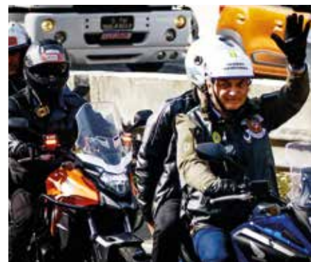
De Braziliaanse president Jair Bolsonaro nam zonder mondkapje en met een open helm deel aan een protestcaravaan van motorrijders in São Paulo.

Die laatsten hebben in Brazilië altijd een ondermijnende rol gespeeld. Hun afkeer van het communisme - nu nog zichtbaar in het embargo tegen Venezuela, het reisverbod