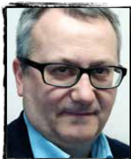
Van de redactie door Bert Cornelis