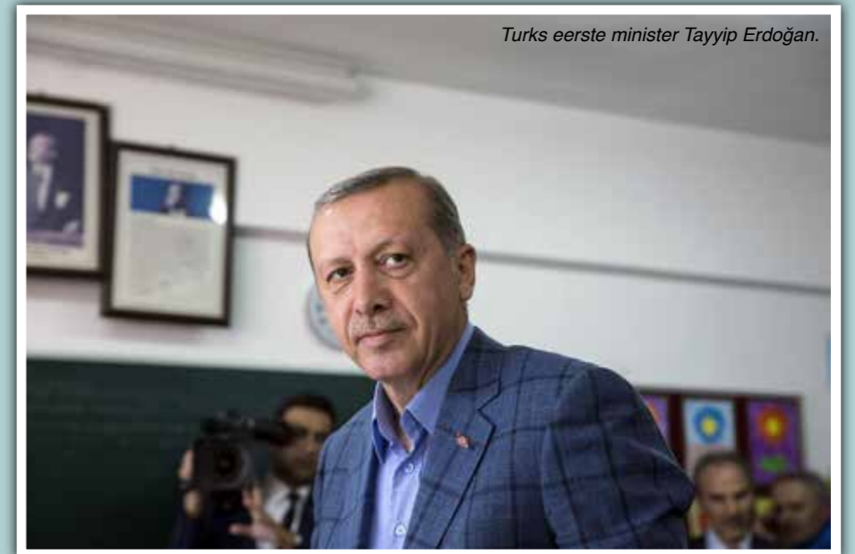
Turks eerste minister Tayyip Erdoğan.

er al drie jaar een ondergrondse brand aan de gang was; op 15 mei dook een rapport op van de Turkse Kamer van Bouwmeesters en Ingenieurs die al in 2010 de alarmklok luidde). Zo blijken een 80-tal oproepen van geblokkeerde kompels te zijn verdonkere-maand. Zo is de kost van de ontginning wel verminderd van 130 dollar per ton in 2005 tot 24 dollar vandaag, maar waarop is bespaard? Alweer op veiligheidsvoorzieningen, zo blijkt; zoals de bouw van een aparte ontsnappingsschacht of de controle op de aanwezige koolmonoxyde of op tekortkomingen waarover CHP-kamerlid Özgür Özel drie weken tevoren opheldering vroeg maar wat de AKP-meerderheid van tafel veegde. Maar de omzet is wel ruim verdubbeld op drie jaar tijd. En het aantal ongevallen niet minder. Turkije is het derde gevaarlijkste land ter wereld geworden voor arbeidsongevallen, sinds 2000 zijn al duizend kompels verongelukt. Het politieke staartje is sneu voor Erdoğan. De vrouw van de huidige algemene directeur van Soma Komur İşletmeleri AS is einde maart in de provincie gekozen voor de AKP.