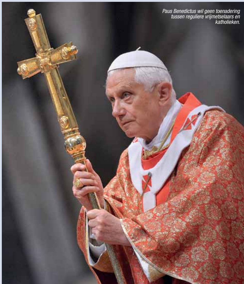
Paus Benedictus wil geen toenadering tussen reguliere vrijmetselaars en katholieken.