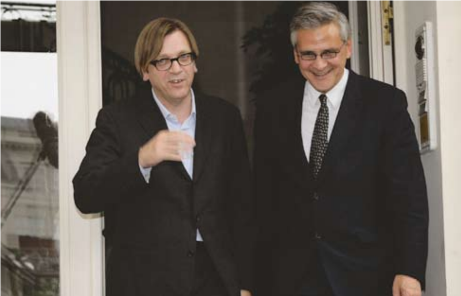
Nog even stond Guy Verhofstadt met Kris Peeters op het bordes van het Errerahuus, maar de Vlaamse minister-president liep al lang in zijn hoofd om Open Vld te dumpen.

neemt toe, de staats hervorming en de splitsing van BHV liggen te wachten; wie zich nu onverantwoordelijk gedraagt, zal achteraf een dubbele rekening krijgen. Gemakkelijk zal het voor de Vlaamse liberalen niet zijn: oppositie voeren in Vlaanderen, met naast zich de onvermijdelijke fractie van LDD, en de regering steunen in België. Een spreidstand die pijn doet. De Vlaamse socialisten kunnen daar van meespreken.