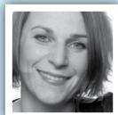
door Ann Brussel Vlaams Parlements lid

De voorbije weken bakkeleide de Vlaamse meerderheid stevig over de toekomst van ons secundair onderwijs. Opvallend in dit debat is de ideologische polarisering die voorbij gaat aan de problemen in het onderwijs. Een analyse van Vlaams Parlements lid Ann Brussel.