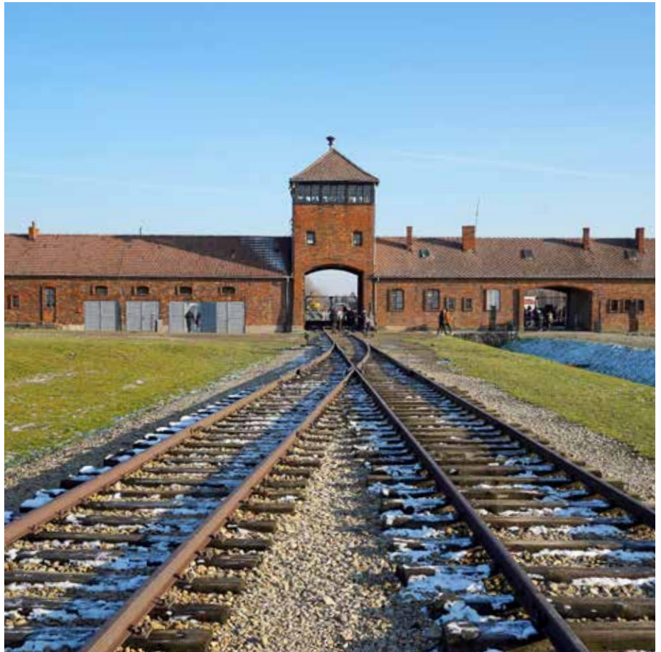
Het concentratiekamp van Auschwitz, net 75 jaar geleden bevrijd.