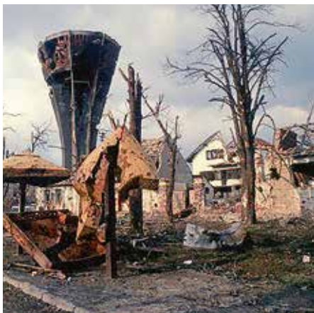
Een beeld van de watertoren in Vukovar na de beschieting in 1992.

interview aan Nova TV op 16 januari. Hij erkent daarin de snelle vergrijzing van Kroatië (door slinkende geboortecijfers en door grote uitwijking van jongeren), en beseft de noodzaak om de gezondheidszorg beter uit te bouwen. “De hoofdstad Zagreb heeft niet eens 4.000 bedden in openbare homes, en de prijs ligt met 4.000 kuna (538 euro) erg hoog. In private rusthuizen kan dat oplopen tot duizend euro. Dat is een ernstig politiek probleem”. Net op een ogenblik dat Kroatië na zes en een half jaar lidmaatschap van de Europese Unie voor het eerst het wisselend voorzitterschap mag opnemen in de eerste helft van 2020 (daarna neemt Duitsland het roer over).