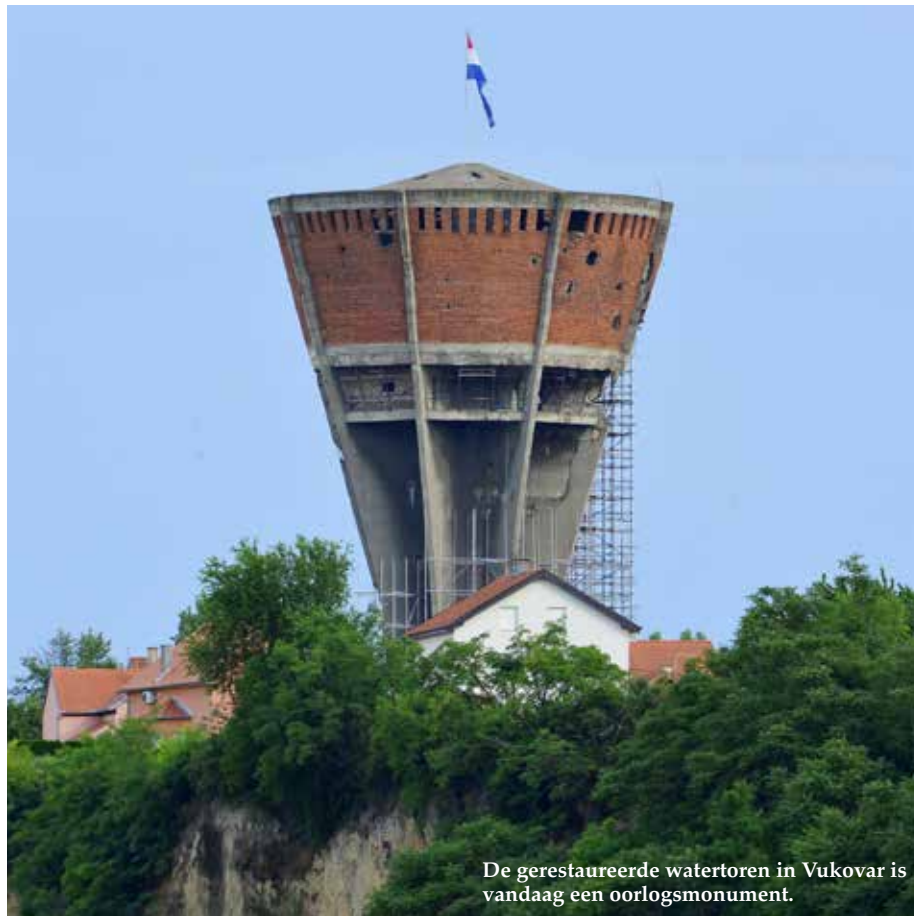
De gerestaureerde watertoren in Vukovar is vandaag een oorlogsmonument.

Wat scheelt er dan met Kroatië als de oude-renopvang ondermaats is en de landvlucht niet af te remmen? De sociaaldemocraten wijten het aan endemische corruptie. Het is wellicht de reden waarom Milanović onverwacht de uittredende presidente van de conservatief-nationalistische HDZ, Kolinda Grabar-Kitarović, kon wippen. Haar HDZ is lid van de Europese Volkspartij (EVP), maar zit verveeld met de veroordeling van Ivo Sanader, de langstregerende eerste minister die het moderne Kroatië gekend heeft (2003-2009). Sanader had enkele uitschuiers gemaakt die hem niet in dank zijn afgenomen. Hij bekeerde zich van euroscepticus weliswaar tot campagneleider voor de toetreding