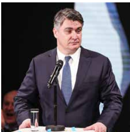
De nieuwe Kroatische premier Zoran Milanović zal zich vooral over de gezondheidszorg moeten buigen.

tot de EU, maar die besprekingen werden lange tijd opgeschort na zijn weigering om de Kroatische generaal Ante Gotovina uit te leveren aan het Internationaal Gerechtshof in Den Haag, dat hem in 2010 voor oorlogs-