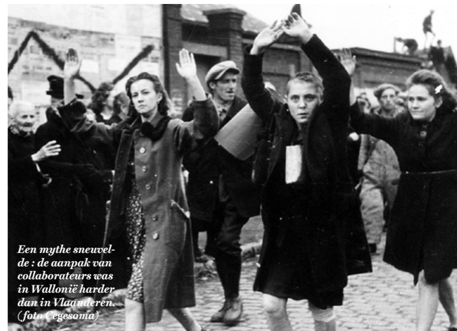
Een mythe sneuvelde: de aanpak van collaborateurs was in Wallonië harder dan in Vlaanderen.

We krijgen dus flarden monoloog, van getuigen in steeds hetzelfde décor, wat me doet