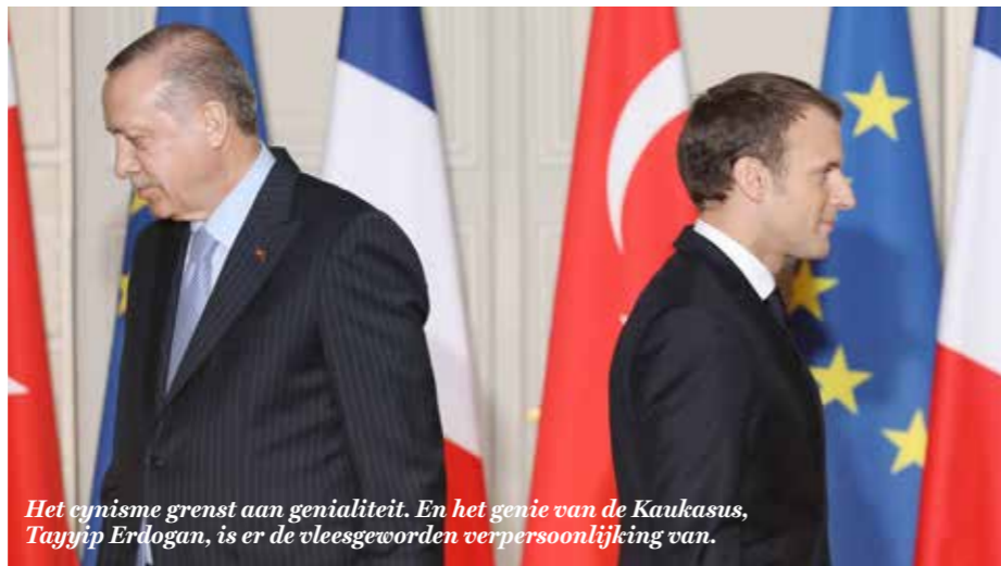
Het cynisme grenst aan genialiteit. En het genie van de Kaukasus, Tayyip Erdogan, is er de vleesgeworden verpersoonlijking van.

De hele bocht van 180 graden die Turkije gemaakt heeft kort voor de kerstdagen om te ijveren voor vriendschappelijke samenwerking met de EU heeft niets vandoen met de Amerikaanse barsheid (hoewel ook die van verregaande onwetendheid getuigt). Wel met de verdere instorting van de Turkse munt, de lira, met de nakende herverdeling van de invloedssferen in Voor-Azië na de militaire