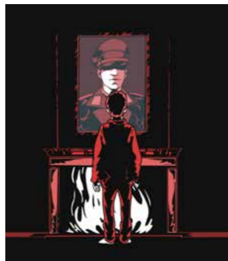
Het generiekbeeld van de Canvas-reeks "Kinderen van de Collaboratie".

Die gegevens die ik nergens betwist zag, geven een heel ander beeld van de Oostfronters dan wat Canvas ons te zien gaf. De overigens zeer boeiende reeks, -ik heb ze nu al twee keer bekeken op mijn tablet-, stoelt op de getuigenissen van veertien "kinderen" van collaborateurs die tussen de 44 en de 91 jaar oud zijn. Bijna allemaal wijten zij de collaboratie van hun