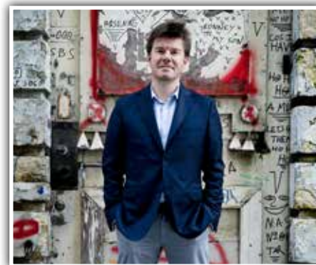
Minister van Cultuur Sven Gatz op de LVV-nieuwjaarsreceptie: “Je moet mensen laten voelen dat bier iets van hun eigen cultuur is, dat het meer is dan gewoonweg een pint in de hand houden.”

De Vlaamse werf van Gatz is uiteraard de