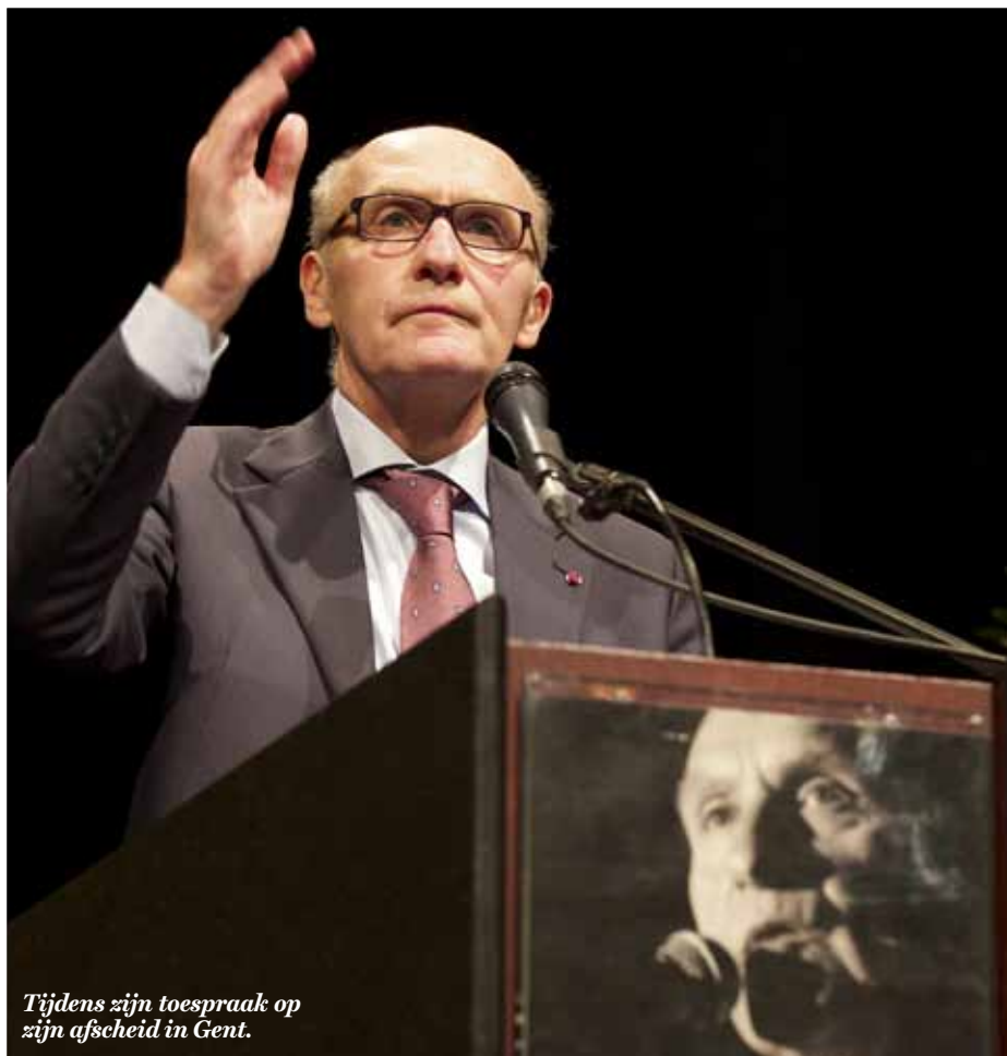
Tijdens zijn toespraak op zijn afscheid in Gent.