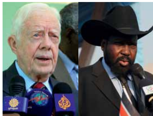
Waarnemer Jimmy Carter.

Zuid-Soedan wordt een interessant experiment, dat nogal wat zwarte leiders met argwaan bekijken. De facto afscheidingen waren er legio: in Kongo (Katanga), in Tsjaad, in Somalië (Puntland), in Angola met