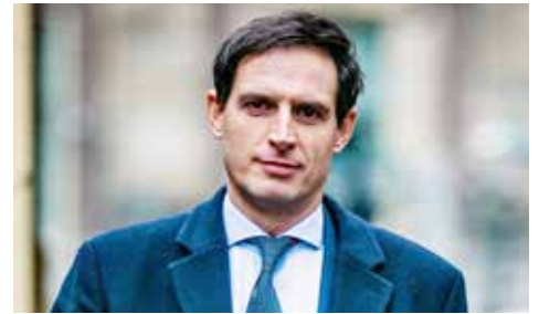
Minister van Financiën Wopke Hoekstra trekt de CDA-lijst en hoopt opnieuw op een zitje in het kabinet.