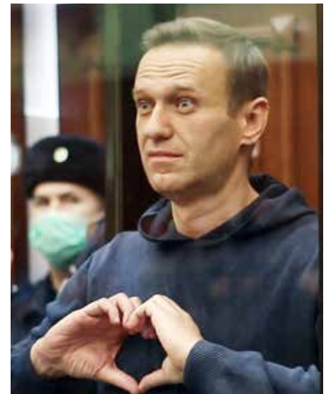
Het oppakken van de Russische oppositieleider Alexei Navalny ontketende straatprotest en groeiende onvrede tegen het regime-Poetin.

Natuurlijk geeft de EU de voorkeur aan een open, vrije markt, op grond van handelsverdragen en toezicht in de WHO. Maar beledigingen en provocaties (geweld: Syrië, Armenië, Oekraïne; computeraanvallen: Estland, Duitsland, Italië) dient de Unie niet goedschiks te laten passeren. Als ze haar waarden verdedigt, dan moet ze de vrijheden ook verdedigen, en internationaal ingrijpen tegen het muilkorven van vrije meningsui-