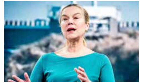
Minister en oud-diplomate Sigrid Kaag trekt de lijst van D'66 en is het gezicht van 'links' Nederland.

Op woensdag 17 maart kunnen de Nederlandse kiesgerechtigden hun stem uitbrengen voor de 150 zetels in de Tweede Kamer (TK) van de Staten Generaal. Er komen liefst 37 politieke partijen op. De voornaamste partijen hebben kandidaten in alle 20 kiesgebieden, maar dat hoeft niet en zo constateert men dat – bijvoorbeeld- de 'partij voor de republiek' enkel opkomt in twee kiesgebieden. Bij de vorige TK-verkiezingen behaalde de VVD (Volkspartij voor Vrijheid en Democratie) 33 zetels met 21,29% der stemmen en de kleinste partij (FVD: Forum Voor Democratie) kwam uit op 1,78%, wat goed is voor 2 zetels in de Tweede Kamer. Door het