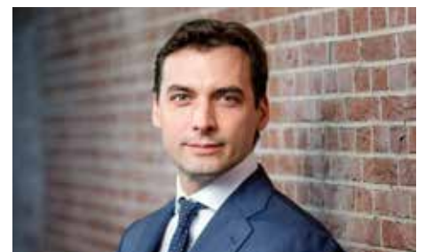
Zal woelwater Thierry Baudet (Forum voor Democratie) nog een zetel halen?