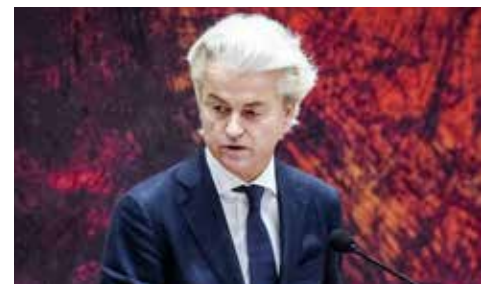
PVV-lijsttrekker Geert Wilders hoopt opnieuw op een gedoogkabinet met Rutte.