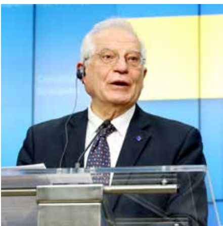
Het bezoek van de Europese Hoge Vertegenwoordiger voor Buitenlands en Veiligheidsbeleid, Josep Borrell Fontelles, aan Moskou werd een schertsvertoning.

Dat engnationalisme van Borrell kun je evengoed zijn grootste critici aanwrijven: Polen, de Baltten, en misschien nog veel meer Hongarije dat gretig Spoenikvaccins heeft aangekocht bij de vroegere bezetter, turven ook aan een onverwerkt verleden, eigen belang voor Europees belang. Misschien wel iets begrijpelijker, want de rancune voor en in de Koude Oorlog heeft hen uitermate gevoelig gemaakt voor de nietsontziende onbetrouwbaarheid van de grote buur. Jammer genoeg passen met name Polen en Hongarije dezelfde methodes toe als de Russische Federatie en zijn satrapen, zoals Wit-Rusland of Turkije – de marionetten die hun eigen repressieve gang mogen gaan, en zich zelfs mogen opdraken met gebieds- en invloedsuitbreiding (de zaak Nagorno-Karabach is een schoolvoorbeeld), maar niet doorhebben dat hun macht wegsijpelt naar nieuwe uitbreiding van de Russische invloedssfeer. Voeg daar het ont-