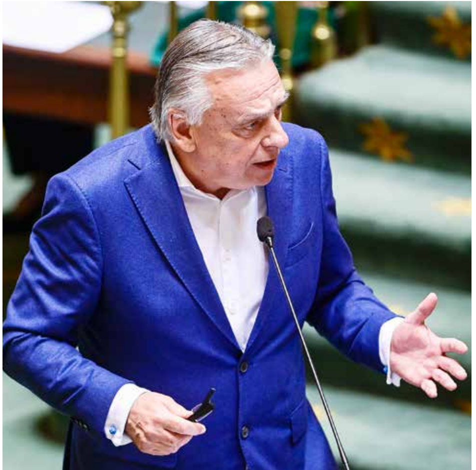
Minister van Staat Patrick Dewael.