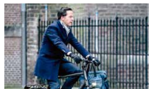
Zal Mark Rutte mogen verder fietsen als minister-president?