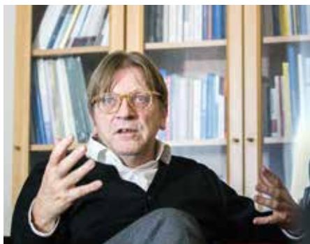
Europees parlamentslid Guy Verhofstadt was bikkelhard voor de Italiaanse premier Conte.

uitgenodigd door Confindustria Russia, de vereniging van Italiaanse bedrijven met vestigingen in Rusland. Het Kremlingsponsorde Spoenik was er als de kippen bij om Salvini te laten verklaren dat die sancties “absurd” zijn. “Ik voel me hier beter thuis dan in ettelijke landen van de EU”, zei hij zonder verpinken. “Europa moet zich opbouwend opstellen, Italië heeft al 20 miljard euro verloren door de handelsoorlog. Als Europa tot nog zwaardere maatregelen overgaat, dan zullen wij in geen enkel geval meedoen”. Salvini hecht evenmin geloof aan de “mythe” dat (Russische) spionnen in Groot-Brittannië (en nu ook in Bulgarije) tegenstanders zouden vergiftigd hebben.