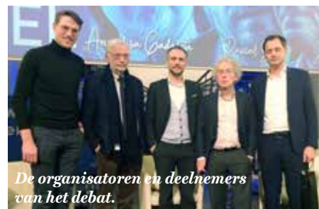
De organisatoren en deelnemers van het debat.

Conclusie: als er nog een grote staatshervorming komt, moet ze losgekoppeld worden van regeringsvormingen, politiek getouwtrek, nachtelijke vergaderingen of pogingen om het land zelf onderuit te halen. Onbevangingen, met als doel efficiënt bestuur. –B.C. •