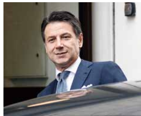
De Italiaanse premier Conte is een koule minnaar van Europa.