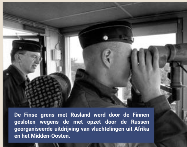
De Finse grens met Rusland werd door de Finnen gesloten wegens de met opzet door de Russen georganiseerde uitdrijving van vluchtelingen uit Afrika en het Midden-Oosten.

De toetreding tot de EU, samen met het ook al "geneutraliseerde" Oostenrijk, in 1995 was het sluitstuk van oostelijke inmenging, hoewel het land steeds afhankelijker werd van Russische energie. Ik herinner me nog hoe toenmalig regeringsleider Esko Aho van centrumrechts (KESK) altijd bereikbaar was voor een interview in Helsinki of Brussel in de jaren dat hij de toetreding met volle overtuiging voorbereidde (1991-1995). Nochtans waren het crisisjaren. Toch kon