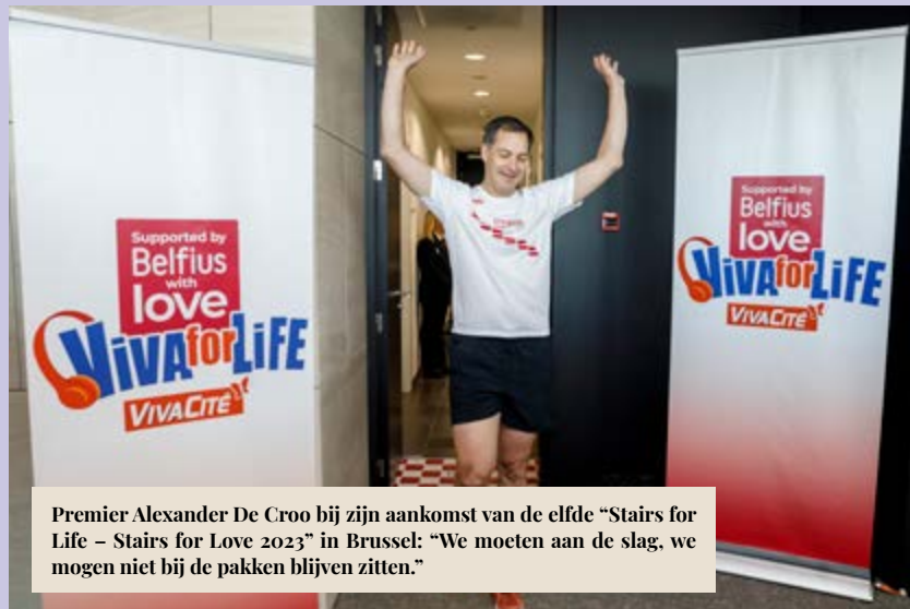
Premier Alexander De Croo bij zijn aankomst van de elfde "Stairs for Life – Stairs for Love 2023" in Brussel: "We moeten aan de slag, we mogen niet bij de pakken blijven zitten."

Door de schamele toestand van de partij komt de optimistische boodschap in het boek van Alexander De Croo niet geloofwaardig over. Een groep ruziemakers die elders pleit voor constructief samenwerken is gewoonweg niet serieus te nemen.