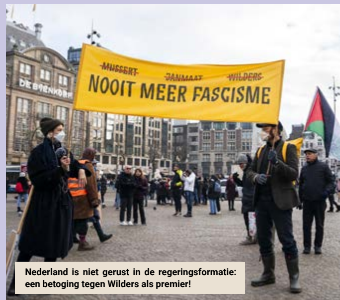
Nederland is niet gerust in de regeringsformatie: een betoging tegen Wilders als premier!

Als Nederland er niet uitgeraakt dan rest de nieuwe Tweede Kamer niets anders dan het volk opnieuw naar de stembus te roepen. Welke politieke partij, buiten de PVV met Geert Wilders, zit daarop te wachten?