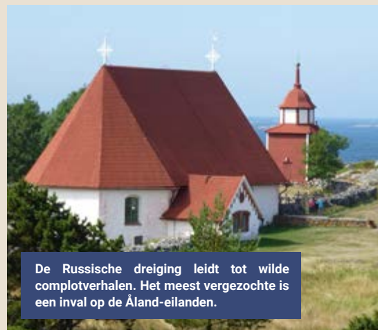
De Russische dreiging leidt tot wilde complotverhalen. Het meest verzochte is een inval op de Åland-eilanden.

Ten slotte komen er maatregelen tegen de georganiseerde uitdrijving van vluchtelingen uit Afrika en het Midden-Oosten. Opgezet door Moskou. Van lieverlede heeft Finland alle acht bestaande grensposten afgesloten, als laatste de meest noordelijke bij Raja-Jooseppi in Lapland.