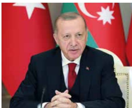
Wankelt het regime van Erdoğan?