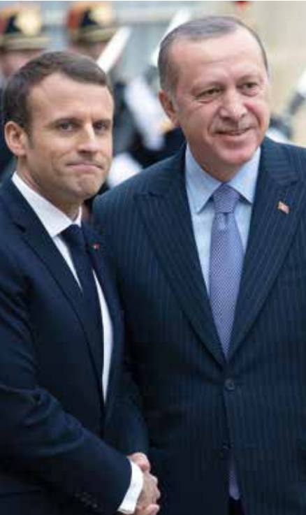
Macron en Erdoğan: geen vrienden meer.