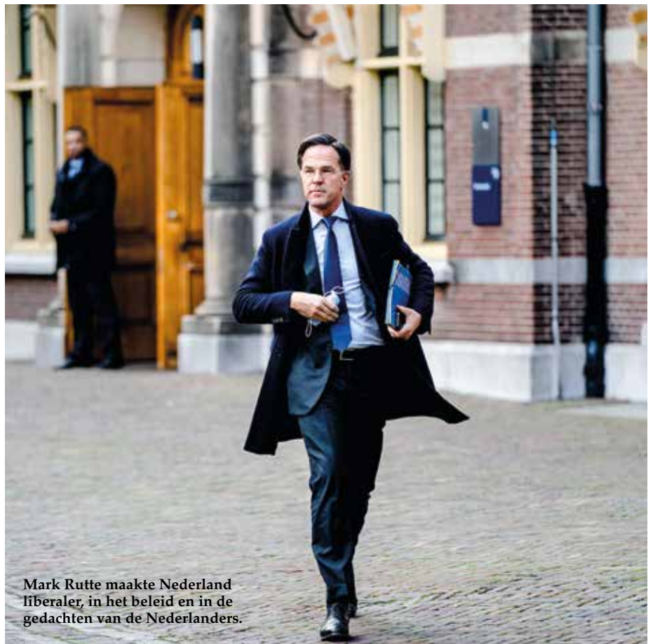
Mark Rutte maakte Nederland liberaler, in het beleid en in de gedachten van de Nederlanders.

Het is blijkbaar nogal wat media en burgers bij ons ontgaan, maar de Nederlandse liberale regeringsleider Mark Rutte is al tien jaar Minister-President in de noordelijke Nederlanden en de bewoner van het 'Torentje', de kanselarij van het Koninkrijk der Nederlanden. Het afgelopen decennium passeerden bij ons liefst vijf eerste ministers: Yves Leterme, Elio Di Rupo, Charles Michel, Sophie Wilmès en Alexander De Croo. Wat is nu de basis van het succes van deze eeuwige protestantse vrijgezel uit het jaar 1967 die de grootste partij van het land leidt: de conservatief liberale VVD (Volkspartij voor Vrijheid en Democratie)?