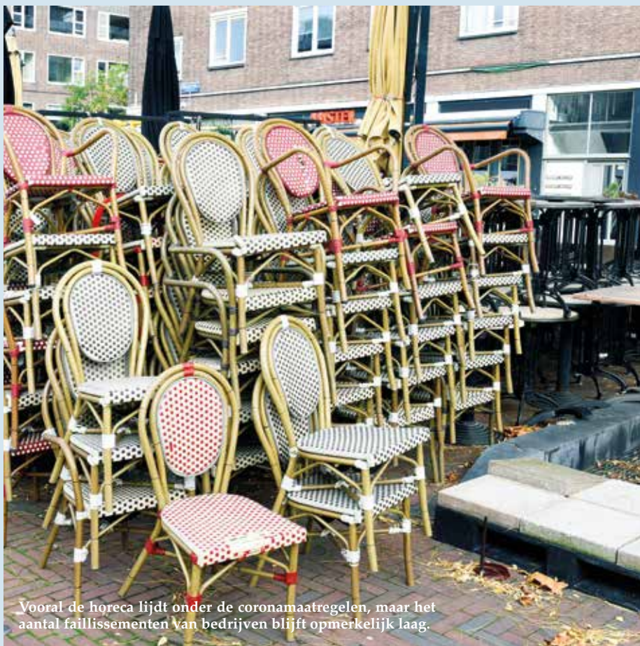
Vooral de horeca lijdt onder de coronamaatregelen, maar het aantal faillissementen van bedrijven blijft opmerkelijk laag.