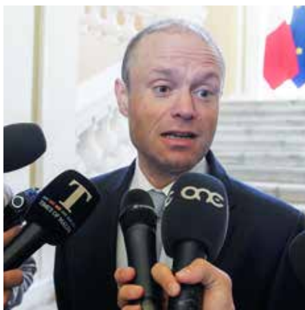
Bij onderzoeken naar corruptie kwam ook de naam van premier Muscat bovendien.