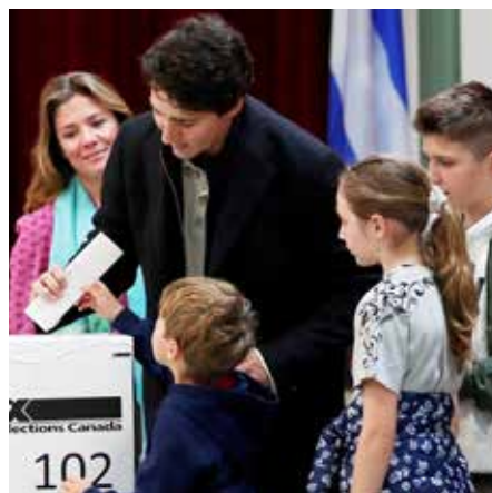
De Canadese premier Trudeau bracht zijn stem uit.

In ieder geval Justin Trudeau zal Canada verder besturen en dat betekent stabiliteit ten aanzien van ons met het CETA-akkoord alsook de NAVO. Want Canada is een onderbenutte handelspartner en is noodzakelijk voor onze militaire verdediging. Men mag niet vergeten dat het westelijk deel van Vlaanderen in 1944 is bevrijd door Canadese troepen. Maar met een moeilijke uitslag is er bijzonder snel een nieuwe regering te Ottawa. Onze politieke- en economische leiders hebben er alle belang bij om meer contacten te leggen met dit land van de 'Maple leaf flag' (Esdoornblad) oftewel: Canada! ■