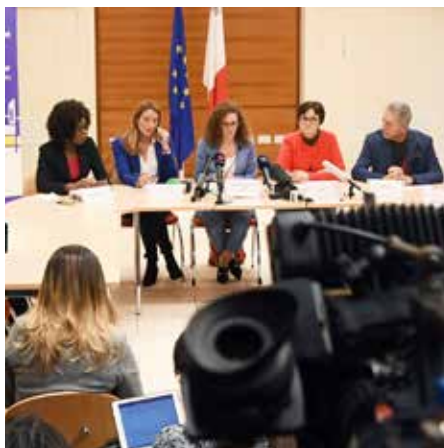
Het Europees Parlement stuurde een onderzoekscommissie naar Malta.

En de vastgoedsector is al helemaal knudde. Helemaal schokkend is de deal over het Vitals ziekenhuis. Dat gaat 2 miljard euro wegsluizen, maar niemand weet wie de eigenaars van Vitals zijn. De casinowetgeving is een lachertje. De BTW op luxe goederen een grap.