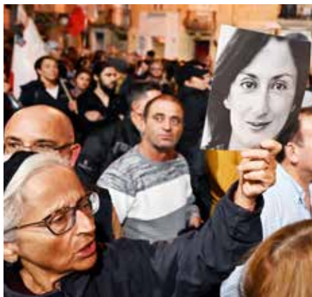
Begin december waren er in Malta nog protesten tegen de moord op de journaliste Daphne Caruana Galizia.

De achilleshiel van elk gerechtelijk onderzoek is de lakse houding van Malta tegenover offshore vestigingen en betalingen. Bleef het daar maar toe beperkt. Maar er is een structurele corruptie die al jarenlang de hand boven het hoofd gehouden wordt. Liefst 60 % van de bedrijfsleiders op Malta geeft aan dat hun eiland vergeven is van onfrisse praktijken. Dat gaat van eenvoudige dingen als het tegenhouden van de Europese vogelrichtlijn (de vogelaars aan de steile kusten zijn niet van plan hun hobby op te geven) tot verwerpelijke praktijken zoals het verlenen van Maltese paspoorten aan Russische, Chinese, Arabische en andere rijkelui in ruil voor investeringen. Voor 900.000 euro kun je de nationaliteit kopen. Witwassen van geld uit smokkelhandel en onderhandse overeenkomsten is meer dan een plaag. Banken zijn onbetrouwbaar geworden, niet voor niets heeft de ECB een doorlichting geëist van de Bank of Valletta.