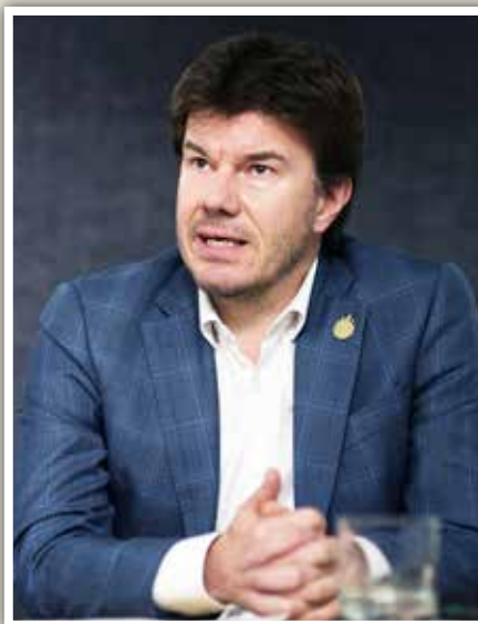
Minister van Cultuur Sven Gatz zoekt met de VRT naar een alternatief voor de 'derden'.

de vinger in de wonde door te spreken over levensbeschouwelijke eilanden die tot op heden ieder afzonderlijk hun 'monoloog' aanboden. Hij heeft natuurlijk een punt, en zijn pleidooi is consistent met zijn strijd voor hetzelfde principe in het onderwijs. Maar de dragers verschillen: onderwijs en media. Laten we kinderen en jongeren op school "dialoog" aanleren. Een openbare omroep blijft best bij informatie, achtergrond en duiding. In de nieuwsgaring, in de keuze van documentaires en duidingsitems, zou het vanzelfsprekend moeten zijn dat de openbare omroep aan alle levensbeschouwingen hetzelfde belang toekent wanneer het gaat over actualiteitswaarde, en dat daarbij debat, vergelijk, confrontatie niet uit de weg gegaan wordt. Propaganda hoort niet, dialoog hoeft niet.