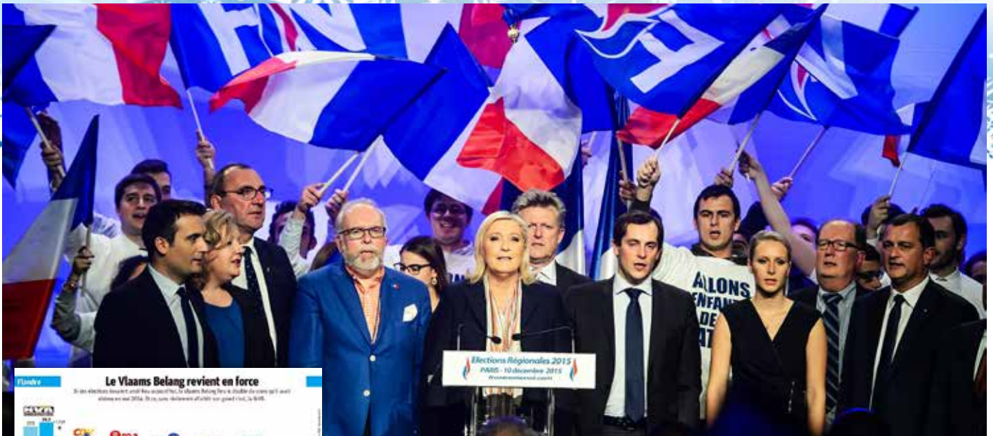
De uitslag van de peiling afgenomen begin december van La Libre Belgique van 14/12/15: N-VA en Vlaams Belang gaan vooruit, de traditionele partijen verliezen.

Om 18u30 blikt minister van Staat Karel De Gucht vooruit op "2016: het jaar na Bataclan" - Afsluitend nieuwjaarsreceptie NH Hotel du Grand Sablon - Bodenbroekstraat 2/4, 1000 Brussel - Aanmelden a.u.b. : telefoon 09/221.75.05 - mail info@hettlvv.be