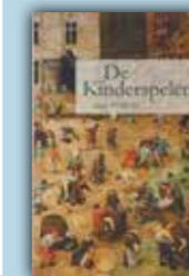
Marc Pairon, De Kinderspelen . Uitg. Stichting Charles Catteau, Aartselaar, 2013; 233 blz.; 14,50 euro.

‘De Kinderspelen’ blijft boeien door de humor, de fantasie, absurde situaties en onvergetelijke citaten. Pairon verlegt het mystieke en het fabelachtige naar het realistische, Het groteske, de spot, de dagelijkse werkelijkheid zijn met elkaar verweven: een fijnzinnig sprookje voor volwassenen.