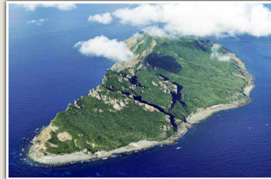
Aanleiding tot het conflict is de territoriale betwisting over een onooglijke hoop rotsblokken, goed voor 7 vierkante kilometer: de Tiaoyutai eilanden.

Japan verweert zich. "Wij hebben de onbewoonde Senkaku opgenomen in 1895, ze waren toen terra nullius", internationaal aanvaard niemandslaan. Er is Japanse economische activiteit geweest tussen 1900 en 1940, toen de laatste van 200 arbeiders vertrok. De eilanden waren Japans privébezit. Maar terecht werpen Taiwan en China op dat de uitbating gebeurde in het kielzog van het ongelijke Verdrag van Shimonoseki, na een