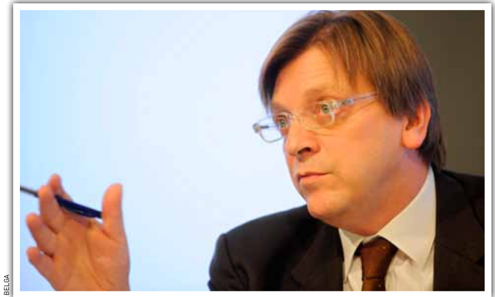
Januari 2008: Guy Verhofstadt schrijft een brief aan Koning Albert II met daarin zijn visie op de staatshervorming. Hij wil een versterking van de 'Federatie België'.

Zaterdag, 7 december 2002. Met een kleine meerderheid van 128 stemmen voor, 122 tegen en 4 onthoudingen keurt het partijcongres van de VLD de 'Novemberverslaring' goed met daarin de term 'confederalisme'. Zeer tegen de zin van de partijtop met voorzitter Karel De Gucht voorop. Tien jaar later is de term 'confederalisme' minder beladen dan toen. Maar de vraag blijft voor welk Vlaanderen de Vlaamse liberalen in de toekomst willen kiezen.