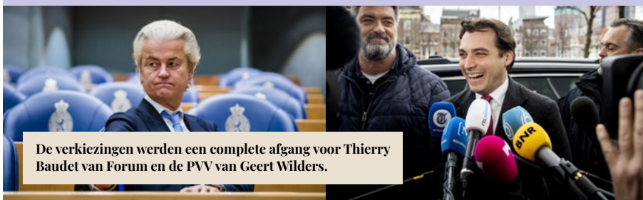
De verkiezingen werden een complete afgang voor Thierry Baudet van Forum en de PVV van Geert Wilders.