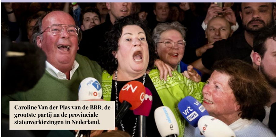
Caroline Van der Plas van de BBB, de grootste partij na de provinciale statenverkiezingen in Nederland.