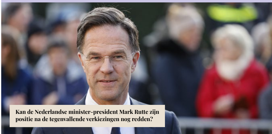
Kan de Nederlandse minister-president Mark Rutte zijn positie na de tegenvallende verkiezingen nog redden?