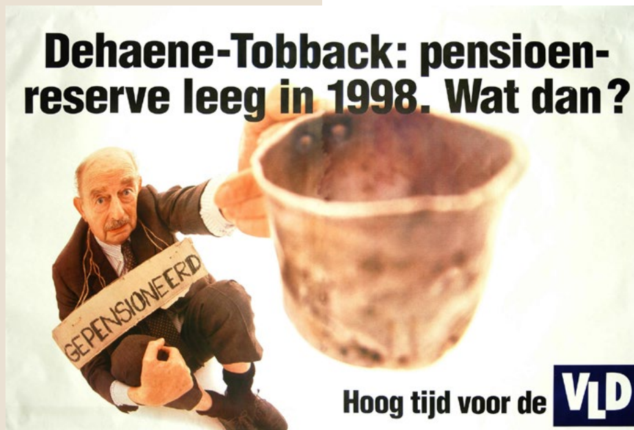
Liberalen moeten de dingen op scherp stellen. Ook in het verleden (affiche voor de verkiezingen van mei 1995) deden zij dat.

Liberalisme heeft altijd en overal te maken met sociale mobiliteit, mensen de ruimte laten om zaken te proberen en tot zelfontwikkeling te komen. Op dat vlak zijn slagzinnen zoals 'werken moet lonen' tijdloos en relevant. Toch moeten we ook kijken naar het bredere plaatje. Als de zogenaamde 'middenklassedroom' niet realistisch is voor iedereen die haar of zijn best doet, dan zit er iets fundamenteel fout. Werken moet niet alleen lonen, het moet ook mensen écht vooruit laten gaan. Hardwerkenden moeten uit armoede over lagere middenklasse tot de middenklasse kunnen toetreden binnen één generatie. We mogen bijvoorbeeld niet