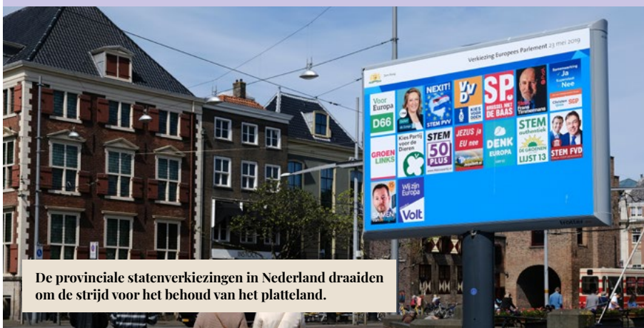
De provinciale statenverkiezingen in Nederland draaiden om de strijd voor het behoud van het platteland.