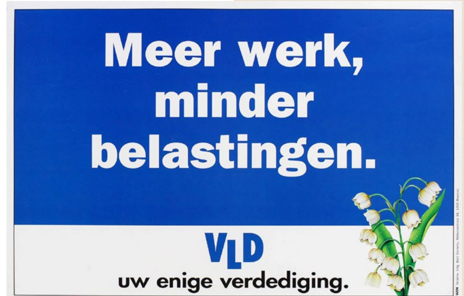
Loon naar werken en minder belastingen is altijd al een belangrijk thema geweest voor liberalen. Een affiche van 1 mei 1997.

Ook de externe bedreigingen nopen ons tot alertheid. Waar vroeger pacifisme een zeer aanwezige factor was binnen de liberale beweging, dwingt de realiteit ons tot een assertievere visie op defensie. In die zin had de PVV en VLD hier al altijd een realistischere positie dan wat internationaal en ideologisch leefde. Waar voor alle vormen van vrijhandel de voordelen ruimschoots doorwogen tegenover nadelen, moeten we erkennen dat zeer specifieke strategische assets zoals haveninfrastructuur en telecommunicatie moeten overlaten aan de hoogste bidder. Feitelijke controle door buitenlandse mogendheden moet vermeden worden.