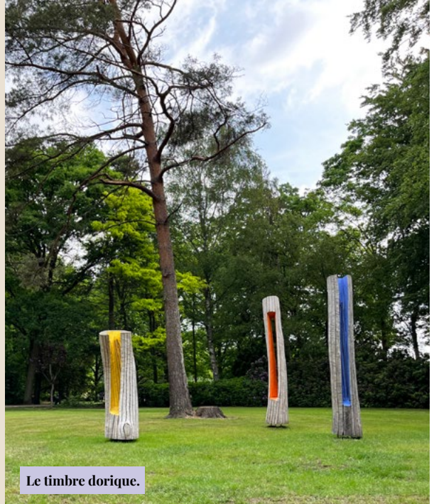
Le timbre dorique.

Werk van Philippe Gouwy wordt tentoongesteld in Flooat Gallery, Zuidleiestraat 38, 9880 Aalter gedurende 3 weekenden in mei: https://www.flootgallery.com en bij Beukenhof-Phoenix Galleries, Ronde van Vlaanderenstraat 9, 9690 Kluisbergen van 1 mei tot eind september op zaterdag, zondag en feestdagen van 14u tot 19u en na afspraak. www.philippegouwy.be .