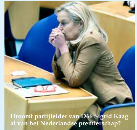
Droomt partijleider van D66 Sigrid Kaag al van het Nederlandse premierschap?

Tevens moet er gezocht worden naar een meerderheid binnen de Eerste Kamer. Want die was afwezig bij Rutte III en dat leidde meermaals tot problemen in de Nederlandse Senaat. Het ziet er naar uit dat deze regeringsvorming zeer lang gaat duren. Want de eerste pogingen gingen naar de afgrond door het gebrek aan geheimhouding, discretie en dus geen vertrouwen. Nogal wat partijen willen niet meer verder met Mark Rutte als minister-president. Maar de VVD gaat als grootste partij en met zo een stemmenkanon dit niet zomaar laten gebeuren. Desalniettemin heeft de VVD een probleem, want er staat geen opvolger klaar na Mark Rutte. Trouwens als Rutte niet in de regering kan, dan zal VVD hetzelfde eisen voor Kaag. Beiden fractieleider maken in de Tweede Kamer zou pas vuurwerk geven.