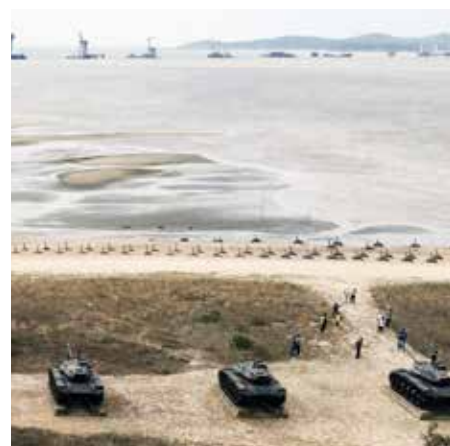
Het eiland Kinmen, of Quemoy.

Diplomatiek heeft China zich na de Culturele Revolutie (1966-1976) opgeworpen als de grootste verdediger en geldschieter (later bleek het vaak om woekerleningen te gaan) van wat de “Derde Wereld” heette. Peking kocht gewoon armlastige regeringen – en hebzuchtige regeringsleiders – uit om zijn eigen belangen (ertsen, mineralen, olie) te ver-