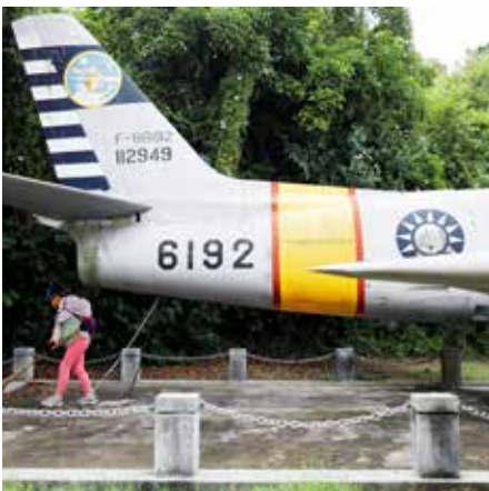
Het hele eiland Kinmen is vandaag een open museum, er staan zelfs nog vliegtuigen uit de jaren vijftig die je anders alleen nog in stripverhalen van Buck Danny terugvindt. De Sabre F-86!

In de VS wordt al duchtig gespeculeerd over hoe China een lesje te leren. The Economist ziet de militaire verzwakking van de VS, maar ook hefbomen: bij een aanval kun je onmiddellijk "geo-economische afschrikking" activeren. Die sluit China uit van alle dollargerelateerde financiële en handelsbewegingen. Volstaat dat niet, dan kan de Zevende Vloot alle zeewegen afsluiten voor in- en uitvoer, en China volledig weren van de kapitaalmarkten. Dat klinkt ambitieus. Een glas Kaoliang zou hier best op zijn plaats zijn. ■