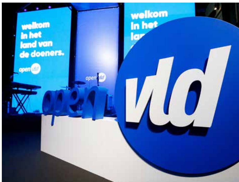
Open Vld heeft nu de kans om een vernieuwing op te starten voor de liberale familie en voor de Vlaamse democratie in het algemeen.

Het belangrijkste punt is misschien wel dat politici niet meer begrijpen wat politiek is. Politiek is veel meer dan het passief vergaren van likes. De kiezer wordt respectloos weggezet als anoniem en gezapig kiesvee. Politiek moet echter een evenwicht zoeken tussen populaire steun enerzijds en inhoud, principes en beleid anderzijds. Voorwaar geen evident evenwicht, dat geven we toe. Maar nu wordt alles geofferd op het altaar van een vage populariteit. De zoektocht van de Instapolitici naar kiezers is het gevolg, zelfs de essentie, van dit marketingverhaal. De politiek-ethische band tussen burger en politicus wordt vervangen door een commerciële band tussen consument en marketer. Onze democratie is verworden tot een supermarkt waar producten op een zo aantrekkelijk mogelijke wijze worden aangeboden.