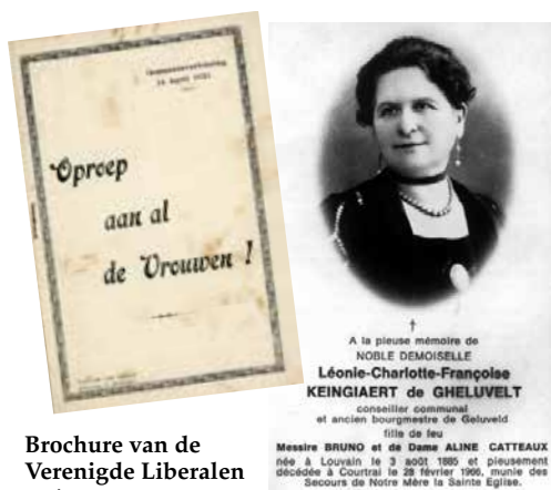
Brochure van de Verenigde Liberalen te Antwerpen voor de gemeenteraadsverkiezingen van 1921