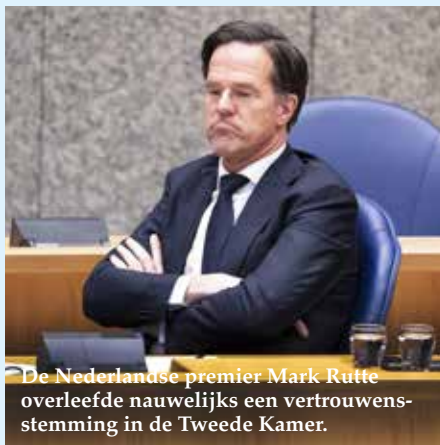
De Nederlandse premier Mark Rutte overleefde nauwelijks een vertrouwensstemming in de Tweede Kamer.

fische spreiding van de leden. Inderdaad liefst 50 TK-leden wonen in de provincie Zuid-Holland en dan volgt Noord-Holland met 39. De provincies Zeeland en Drenthe hebben elk maar één verkozenen! Nog maar zes partijen komen als eerste uit in een gemeente: VVD, D66, CDA, CU, SGP en de PVV. De rechts liberale VVD komt in de meeste gemeenten als eerste uit en dat ook in drie grootsteden: Den Haag (de thuisstad van Rutte), Eindhoven en Maastricht. In alle andere steden komt D66 als eerste uit. De VVD verliest stemmen aan D66 in de rijke West-Hollandse gemeenten. Maar de VVD wint fors bij in Zeeland, Noord-Brabant en Limburg en daar vooral van het CDA. D66 wint ook stemmen bij uit de kiesvijver van GroenLinks.